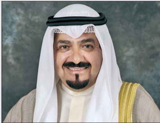
سمو الشيخ أحمد العبدالله رئيس مجلس الوزراء

كونا: بعث سمو الشيخ أحمد العبدالله رئيس مجلس الوزراء ببرقيتي تهنئة إلى أخيه خادم الحرمين الشريفين الملك سلمان بن عبدالعزيز آل سعود ملك المملكة العربية السعودية الشقيقة، وأخيه صاحب السمو الملكي الأمير محمد بن سلمان بن عبدالعزيز آل سعود ولي العهد رئيس مجلس الوزراء في المملكة العربية السعودية الشقيقة، ضمنها سموه خالص تهانيه بمناسبة ذكرى يوم التأسيس للمملكة العربية السعودية الشقيقة. كما بعث سمو الشيخ أحمد العبدالله رئيس مجلس الوزراء ببرقية تهنئة إلى سيريل إيرول تشارلز حاكم عام سانت لوسيا الصديقة بمناسبة ذكرى استقلال بلاده.