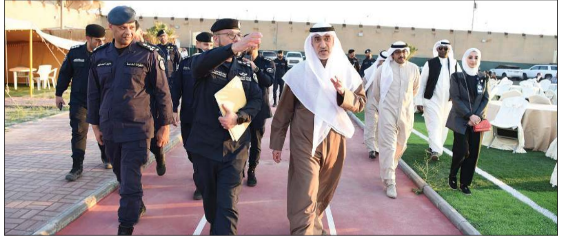
النائب الأول لرئيس مجلس الوزراء ووزير الداخلية الشيخ فهد اليوسف لدى زيارته نزلاء «المؤسسات الإصلاحية»