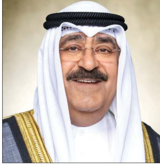
صاحب السمو الأمير الشيخ مشعل الأحمد

عن بالغ اعتزازه بديمومة العلاقات الأخوية الحميمة والوثقى التي تجمع الأسرتين الكريمتين على تعاقب الأزمان، ومثمنا الأواصر الوطيدة والراسخة التي تربط بين دولة الكويت والمملكة العربية السعودية الشقيقة، سائلا سموه المولى تعالى أن يحقق للمملكة العربية السعودية الشقيقة وشعبها الكريم المزيد من التقدم والازدهار في ظل القيادة الحكيمة لأخيه خادم الحرمين الشريفين الملك سلمان بن عبدالعزيز آل سعود - ملك المملكة العربية السعودية الشقيقة. وبعث صاحب السمو الأمير الشيخ مشعل الأحمد ببرقية تهنئة إلى سيريل إيرول تشارلز حاكم عام سانت لوسيا الصديقة، عبر فيها سموه عن خالص تهانيه بمناسبة ذكرى استقلال بلاده، متمنيا سموه له موفور الصحة والعافية، ولسانت لوسيا وشعبها الصديق كل التقدم والازدهار.