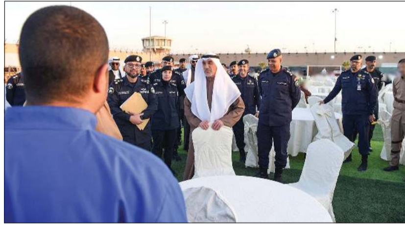
جانب من زيارة النائب الأول لرئيس مجلس الوزراء ووزير الداخلية الشيخ فهد اليوسف لنزلاء «المؤسسات الإصلاحية»

كونا: قام النائب الأول لرئيس مجلس الوزراء وزير الداخلية الشيخ فهد اليوسف بزيارة إلى «المؤسسات الإصلاحية»، حيث التقى عددا من النزلاء وشاركهم وجبة الإفطار، وذلك في إطار حرصه على تعزيز التواصل الإنساني ومشاركتهم أجواء شهر رمضان المبارك، وذكرت وزارة الداخلية في بيان أن الشيخ فهد اليوسف أكد خلال الزيارة أن شهر رمضان يمثل محطة إيمانية مهمة لتعزيز قيم التسامح والإصلاح، وحث النزلاء على استثمار هذه الأيام المباركة في مراجعة النفس وتصحيح المسار بما يعزز فرص اندماجهم في المجتمع بعد انتهاء فترة محكوميتهم. وأشار البيان إلى أن