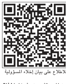
للاطلاع على بيان إخلاء المسؤولية

الجودة أداء دور محوري، لاسيما في ظل إعادة تسعير العوائد إلى مستويات أكثر جاذبية، كما أنها ما تزال قادرة على توفير الدخل، وتعزيز السيولة، وقابلة للتنبؤ، والحماية في سيناريوهات الركود الاقتصادي. إلا أن التنوع في المرحلة الراهنة يتطلب منظوراً أوسع ومنهجية مدروسة، تقوم على دمج مصادر للعائدات تختلف هيكلها في محركاتها وخصائصها. وقد يسهم توسيع إطار استثمارات المحفظة التقليدية ليشمل الاستثمارات البديلة في تعزيز فاعلية التنوع، وتعد استثمارات البنية التحتية وصناديق الحوط من النماذج البارزة لهذا التوجه، فالأصول الأساسية في قطاع البنية التحتية، مثل المرافق المنظمة، وشبكات توزيع الطاقة، وأصول النقل، تميل إلى توليد تدفقات نقدية مستقرة وقابلة للتنبؤ، مدعومة بعقود طويلة الأجل أو باطر تنظيمية. كما أن الطلب على الخدمات الأساسية يتسم بالمرونة، وغالباً ما ترتبط إيراداتها بالتضخم، بما يوفر قدرًا من الحماية الحقيقية للعائدات. ومن منظور إدارة المحافظ، أظهر أداء أصول البنية التحتية تاريخياً درجة استقلال نسبي عن تحركات كل من الأسهم وأدوات الدخل الثابت، وبالمثل يمكن لصناديق الحوط أن تقدم مساهمة جوهرية في التنوع من خلال التركيز على استراتيجيات محددة لا تعتمد على اتجاهات أسواق الأسهم.