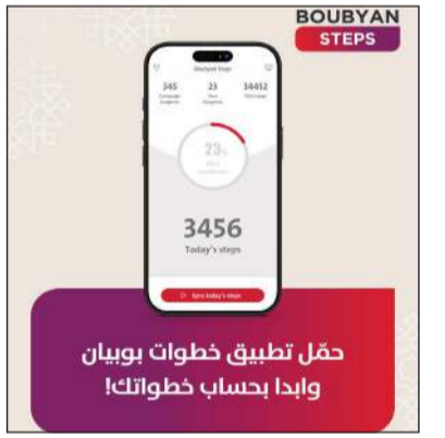
حملة «خطوات بوبيان»