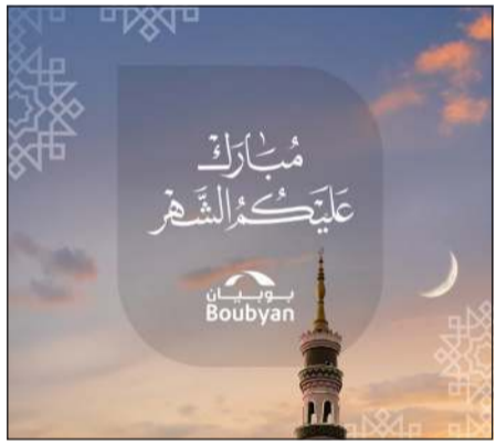
مبارك عليكم الشهر

يرعى بوبيان بطولة Generation Football الرمضانية المخصصة للشباب من الفئة العمرية 16 إلى 25 عاماً من طلبة الجامعات، في أجواء تنافسية تعزز روح الفريق والحماس الرياضي خلال الشهر الفضيل. ويخصص البنك جوائز تتجاوز قيمتها 2000 د.ك للفائز، بما يعكس حرصه على تقديم مبادرات متنوعة تلامس اهتمامات مختلف الفئات.