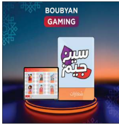
بطولة سين جيم الرمضانية