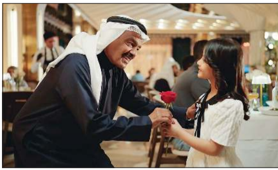
رسالة «رأس المال»