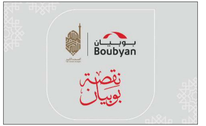
حملة «نقصة بوبيان»