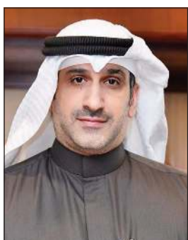
الكابتن عبدالوهاب الشطي

ضمن خطتها الهادفة إلى توسيع نطاق عملياتها وتعزيز خيارات السفر أمام العملاء الكرام، أعلنت شركة الخطوط الجوية الكويتية عن إطلاق رحلتها المباشرة المجدولة إلى مدينة نيس الفرنسية، وذلك بواقع رحلتين بالأسبوع أيام السبت والثلاثاء اعتباراً من تاريخ 4 يوليو 2026، كما أنه من المقرر فتح الحجز اعتباراً من تاريخ 20 فبراير 2026 الساعة 12 الظهر. وفي هذا الشأن، أكد الرئيس التنفيذي للخطوط الجوية الكويتية بالتكليف الكابتن عبدالوهاب إبراهيم الشطي أن إدراج مدينة نيس ضمن جدول الرحلات يأتي استجابة للطلب المتنامي على الوجهات الأوروبية، لاسمها المدن السياحية التي تحظى بإقبال واسع من المسافرين، مشيراً إلى