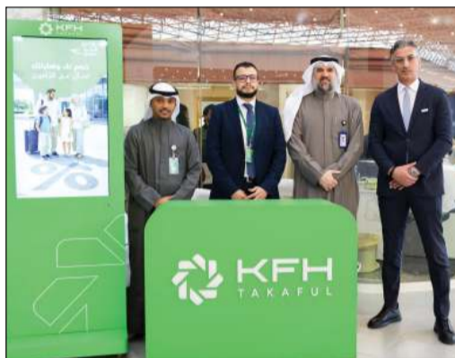
لقطة جماعية للمشاركين في فعاليات اليوم الطبي

نظمت شركة بيتك للتأمين التكافلي «بيتك تكافل» يوماً طبياً بمقر شركة الخطوط الجوية الكويتية تضمن إجراء بعض الفحوصات لموظفي الشركة بالتعاون مع بعض المؤسسات والمراكز الطبية، وذلك في إطار التعاون المشترك وجهود تعزيز العلاقات مع الشركاء وحرص «بيتك تكافل» الدائم على أن تمثل بعلاقتها قيمة مضافة وعنصر دعم لشركائها والمجتمع وعموم المتعاملين معها. وشارك في الفعالية لموظفي شركة الخطوط الجوية الكويتية بعض المراكز الطبية، بجانب شركة «بيتك تكافل» التي رعت ونظمت الفعالية التي حازت التقدير والثناء من الجميع، نظراً لما قدمته من خدمات وما احتوته من فوائد ومزايا لموظفي «الكويتية» الذين شاركوا بأعداد كبيرة فيها. وعلاوة على الشق الطبي، قامت شركة «بيتك تكافل» بتقديم خصومات خاصة لموظفي «الكويتية» وعائلاتهم على جميع أنواع التأمين التي تقدمها، والتي تغطي احتياجات الأفراد والأسر بمنتهى الخدمات متنوعه ومتوافقة مع أحدث المعايير العالمية والضوابط المحلية.