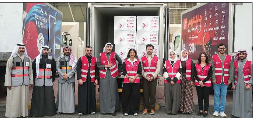
صورة جماعية لفريق سواعد الخليج وبنك الطعام

التي ينظمها بنك الخليج خلال شهر رمضان الكريم، ما يعكس انخراط البنك داخل المجتمع على مدى ستين عاماً، كان خلالها جزءاً لا يتجزأ من تاريخ الكويت الاقتصادي والاجتماعي. يذكر أن حملة بنك الخليج «عوايدنا دوم تجمعنا» تتضمن توزيع الماجة الرمضانية على مدى أربعة أيام، بالتعاون مع البنك الكويتي للطعام، إلى جانب مشاريعه في فعالية «أرض المرح»، التي تم خلالها توزيع المستلزمات المنزلية وكسوة العيد للأسر، بالإضافة إلى الماجة الرمضانية كما قام البنك بإهداء الماجة لرواد لولو هايبر مارك وجمعية الزهراء. وتعكس تلك الفعاليات التزام بنك الخليج القوي ببرامج الاستدامة المجتمعية على المستويات الاجتماعية والاقتصادية والبيئية، عبر العديد من المبادرات التي يتم انقائها بعناية لتعود بالنفع على البنك والمجتمع، تطبيقاً لاستراتيجية البنك الخمسية، وبما يتوافق مع أهداف الأمم المتحدة للتنمية المستدامة ورؤية كويت 2035.