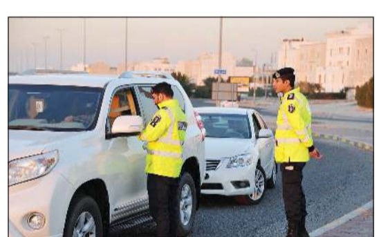
نقطة أمنية لرجال النجدة بإحدى المناطق

واصلت كل من الإدارة العامة للمرور والإدارة العامة لشرطة النجدة حملتهما المرورية والأمنية في مختلف مناطق البلاد لضبط المخالفين والخارجين عن القانون والتعامل الفوري مع البلاغات والحوادث بما يضمن حماية الأرواح والممتلكات وترسيخ هبة القانون، وأسفرت الحملات التي نُفذت خلال الفترة من 5 حتى 13 الجاري عن إحالة 19 حدثاً إلى نيابة الأحداث على خلفية قيادة مركبات دون رخص سوا إلى جانب توقيف 45 مستهتراً وتحرير 24855 مخالفة مرورية متنوعة وضبط 122 مطلوباً والتعامل مع 1588 حادثاً ما بين بسيطة، أي اقتصر خسائرها على مادية، وأخرى خلفت إصابات أو وفيات، إلى جانب ضبط 45 مستهتراً. وبحسب الإحصائية التي حصلت «الأنباء» على نسخة منها، فقد حرر رجال المرور 22970 مخالفة مرورية متنوعة وأحالوا إلى كراج الحجز 322 مركبة و59 درجة نارية، كما تم ضبط 38 شخصاً لانتهاؤهم إقاماتهم و58 مطلوباً ل (تغيب - إلقاء قبض) و20 مركبة مطلوبة قضائياً. وتعامل رجال المرور وفق الإحصائية مع 205 حوادث تصادم وإصابة و1258 حادث تصادم دون إصابات. أما رجال شرطة النجدة فضبطوا 64 شخصاً مطلوباً وحرروا 1885 مخالفة مرورية.