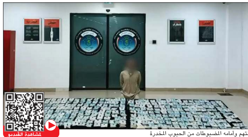
المتهم وأمامه المضبوطات من الحبوب المخدرة

المتهم مقيم في البلاد بصورة غير قانونية وأقر أمام رجال الإدارة العامة لمكافحة المخدرات بأن المضبوطات تخصه وآخر بالخارج