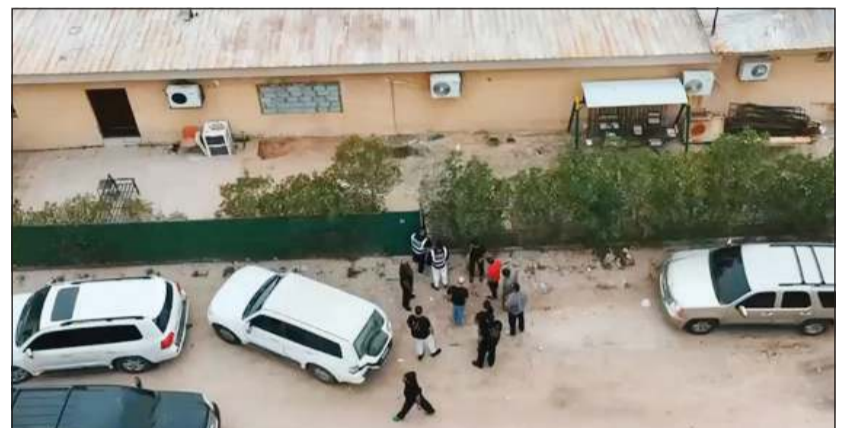
رجال الإدارة العامة لمكافحة المخدرات خلال مدهامة مسكن المتهم

وختم البيان بالقول: يعكس هذا التعاون الأمني المشترك مستوى التنسيق الإقليمي الفعال في مواجهة الشبكات الإجرامية العابرة للحدود، ويؤكد استمرار الضربات الاستباقية لتجفيف منابع المخدرات وتعزيز منظومة الحماية المجتمعية وصون أمن البلاد.