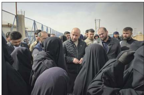
وزير الطوارئ وإدارة الكوارث رائد الصالح خلال جولة له بمخيم الهول

ولن يبقى أحد، وأن عملية الإخلاء بدأت» أمس. وقال مصدر حكومي لـ«فرانس برس» مفضلاً عدم الكشف عن هويته «تعمل وزارة الطوارئ وإدارة الكوارث الآن على إخلاء مخيم الهول في محافظة الحسكة ونقله إلى مخيم في اخترين شمال حلب». وأضاف أن سيارات تقل سكان المخيم خرجت بالفعل من الحسكة متجهة إلى شمال حلب.