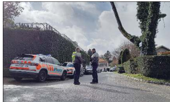
حراسة أمنية لمقر السفير العراقي في جنيف حيث جرت المفاوضات الأميركية - الإيرانية

والقضايا التقنية»، وفق ما نقلت عنه وكالة «تسنيم» الرسمية. وتزامناً مع المفاوضات قالت وكالة أنباء «فارس» الإيرانية إن أجزاء من مضيق هرمز أغلقت لبضع ساعات بسبب «إجراءات أمنية» تتعلق بسلامة الملاح البحرية مع إجراء الحرس الثوري مناورات بحرية في المضيق. وكان الرئيس الأميركي دونالد ترامب وصف محادثات الأمس بأنها «مهمة للغاية». وأضاف في تصريحات للصحافيين على متن طائرة الرئاسة أمس الأول، أن طهران «مفاوضة صعبة، لديهم مفاوضات جيدون»، قبل أن يستدرك ويقول: «لا، في الحقيقة، أعتقد أن مفاوضات الأمس بانها «مهمة للغاية».