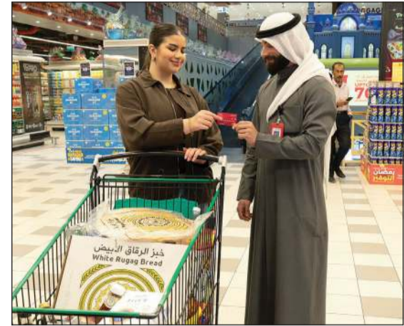
بطاقة لولو من بنك الخليج تهدي المجلة إلى إحدى المواطنات في لولو هايبرالقرين

وتوفر بطاقة لولو هايبر ماركت مسبقاً الدفع الأولى من نوعها في الكويت العديد من المزايا التي جعلت منها خياراً مفضلاً للكثير من العملاء، إذ توفر للزبائن والأمان أثناء عملية الدفع، فضلاً عن العروض والخصومات الحصرية التي يمكن لحاملي البطاقة الاستفادة