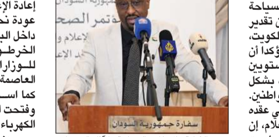
وزير الثقافة والإعلام والسياحة والآثار السوداني خالد الإعييسر متحدثاً (دريش كومار)

لوحدة السودان واستقراره. وأشار إلى أن السودان بدأ مرحلة إعادة الإعمار بعد «دحر التمرد»، لافتاً إلى عودة نحو 4 ملايين مواطن إلى مناطقهم داخل البلاد وخارجها، ولاسيما العاصمة الخرطوم، مع بدء الانتقال التدريجي للسورازي مع المؤسسات الحكومية من العاصمة المؤقتة بورتسودان إلى الخرطوم، كما استأنفت بعض الجامعات نشاطها وفتحت المدارس أبوابها بعد توفير خدمات الكهرياء والمياه.