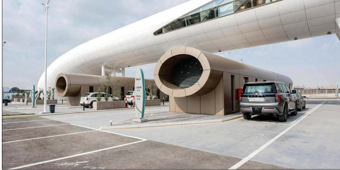
أحد مراكز «تاكده» التابع لـ «الصحة القابضة»

وكشف وزير الصحة عن نجاح المنظومة الصحية في خفض عدد سنوات المرض لدى المواطن بمقدار 3 سنوات، مؤكداً أن هذا الإنجاز جاء ثمرة تكامل الجهود بين مختلف الجهات العاملة في القطاع الصحي، ويمثل انتقالاً نحو مرحلة أكثر نضجاً من الرعاية الصحية الوقائية والشاملة.