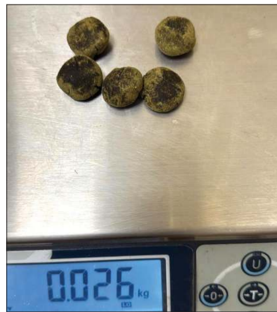
المضبوطات من المواد المخدرة تقارب النصف كيلو من مادة الخشيش