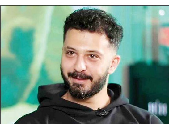
المخرج ميار النوري

يذكر أن المسلسل مكون من 15 حلقة، ومن المتوقع أن يعرض في رمضان المقبل، ويشارك في بطولته: يوسف الحوسني، عباس النوري، خالد القيش، كندا حنا، حسين سعيد، فاطمة البستي، آلاء شاكور، دوجانة عيسى، مي إبراهيم، عمر صعب ومشاعل الشحي، بالإضافة إلى عدد من المقاتلين الأجانب، في خطوة تهدف إلى تعزيز الواقعية في مشاهد القتال ومنح العمل بعدا علميا.