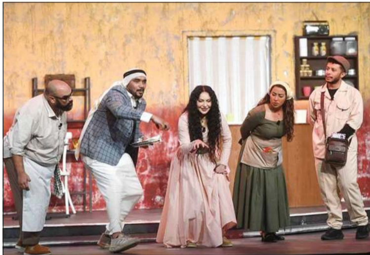
مشهد من مسرحية «مولانا»

وأخيرا عن رأيه في إعادة تقديم الأعمال الأكاديمية بـ «نيولوك» جديد في المسرح الجماهيري، قال: هذا شيء إيجابي