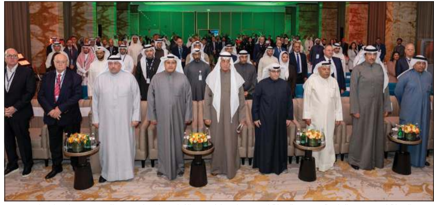
وزير الدولة لشؤون البلدية ووزير الدولة لشؤون الإسكان عبداللطيف المشاري مع الحضور خلال افتتاح منتدى الاتحاد الكويتي للمقاولين لعام 2026

(كويتا): أكد وزير الدولة لشؤون البلدية ووزير الدولة لشؤون الإسكان عبداللطيف المشاري ضرورة دعم قطاع المقاولات وتعزيز الشراكة بين القطاعين العام والخاص لما يمثله هذا القطاع من دور محوري في تنفيذ مشاريع البنية التحتية والإسكان والخدمات والإسهام في تحقيق التنمية المستدامة. جاء ذلك في كلمة الوزير المشاري خلال افتتاح منتدى الاتحاد الكويتي للمقاولين لعام 2026 بحضور نخبة من المختصين وصناع القرار المناقشة القضايا المتعلقة بتطوير قطاع المقاولات ورفع كفاءته وتعزيز تنافسيته في السوق الكويتي.