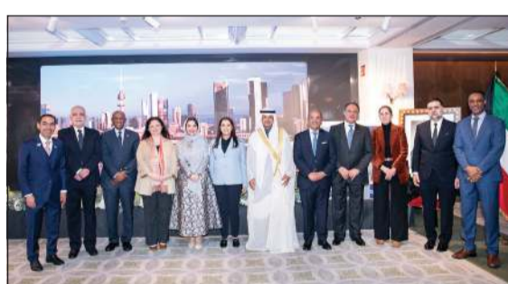
سفيرتنا لدى إسبانيا زهايا الأنجي ورؤساء البعثات الدبلوماسية العربية خلال الحفل