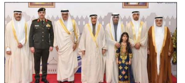
القائم بالأعمال بالإنابة بسفارتنا لدى البحرين المستشار يوسف البنوان ونائب رئيس وزراء البحرين الشيخ خالد آل خليفة ووزير الخارجية عبداللطيف الزباني خلال الاحتفال