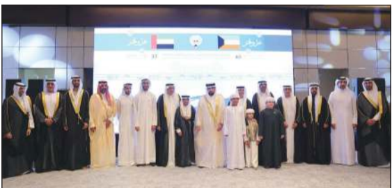
النائب الثاني لحاكم دبي الشيخ أحمد بن محمد بن راشد والقنصل العام للكويت في دبي والإمارات الشمالية خالد الزعابي خلال احتفال قنصليتنا في دبي