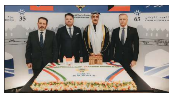
رئيس البعثة الدبلوماسية في سلوفاكيا المستشار سعود الخلد مع المشاركين بالاحتفال

كويتا: واصلت سفارات الكويت حول العالم الاحتفال بالأعياد الوطنية وسط أجواء احتفالية مميزة وحضور كبار المسؤولين والشخصيات في العديد من الدول.