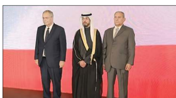
نائب رئيس وزراء لبنان طارق متري والقائم بأعمال سفارتنا بلبنان عبدالعزيز البلح