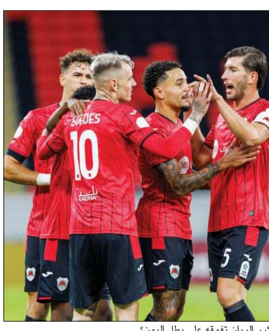
هل يكرر الريان تفوقه على بطل اليمن؟

أوضحت شبكة «اي بي إس إن» أن الاتحاد البرتغالي لكرة القدم يقرب من إسناد مهمة تدريب المنتخب إلى جوزيه مورينيو الذي يشرف حاليا على بنفيكا. وكشفت الشبكة الإخبارية المعروفة عن أن المدرب الحالي للمنتخب البرتغالي، الإسباني روبرتو مارتينيز، سيقترح منصبه بعد كأس العالم 2026، بينما سيقوم المدرب مورينيو بتولي المهمة خلفا له. ورشحت مصادر إعلامية مدرب مان يونايتد السابق روبن اموريه ليكون على رأس المرشحين لتدريب بنفيكا حال رحيل مورينيو.