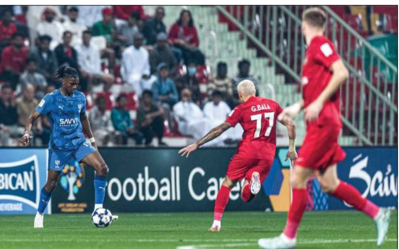
الهلال وشباب الأهلي.. «لا غالب ولا مغلوب»