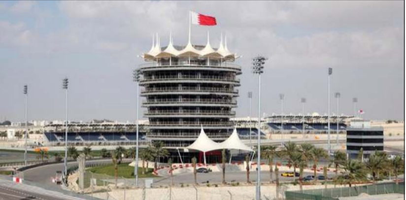
حلبة الصخيرة جاهزة لاستضافة الحدث العالمي

أواخر يناير، راسما صورة لما قد يحدث منذ الجولة الأولى التي تقام في أستراليا في 8 مارس، عندما قد يستخدم أحد السائقين زر «التعزيز+» لتجاوز منافس. إزاء ذلك، تبقى هذه المناورات من أبرز عناصر الإثارة في سباقات الفورمولا واحد، بعد تراجعها على الحلبة، حتى في الموسم الماضي عندما حسم لقب السائقين في الجولة الأخيرة بأبوظبي. ويعد زر «التعزيز» جهازا جديدا على مقود سيارات نسخة 2026، يمنح السائق أقصى طاقة كهربائية متاحة، تصل إلى 350 كيلواط، لتجاوز المنافسين لبضع ثوان فقط. وحذر نوريس من أن كل سائق «سيحتاج إلى السيطرة بشكل أفضل على جميع المواقع» لتجاوز وإدارة مخزون الطاقة المتاح في البطارية بتكتيك عال. وبالإضافة إلى تغييرات الإطارات في الحظيرة وإعادة تصميم الانسيابية، ستكون استراتيجية السباق أكثر تعقيدا بكثير، إذ عند استخدام البطارية للتجاوز في خط مستقيم أو لتجنب أن يتم تجاوزه، «قد ينفد شحن البطارية عند دخول المنعطف». ويعد العالم أربع مرات الهولندي ماكس فيرستابن سائق ريد بول، ومواطنه لويس هاميلتون بطل العالم سبع مرات (فبرايري)، وزميله في مكالارين الأسترالي أوكاسر بياستري.