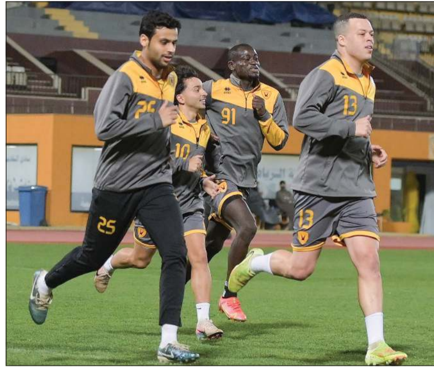
القادسية يسعى للظفر بنقاط مبارياته أمام زاخو اليوم

يخوض القادسية على ملعبه ستاد محمد الحمد وبين جماهيره في الثامنة مساء اليوم مباراة مهمة ومفصلية في الجولة الخامسة من دوري أبطال الخليج، وذلك عندما يستضيف زاخو العراقي ضمن منافسات المجموعة الأولى، حيث يدخل الأصفر لمواجهة برصيد 4 نقاط في المركز الثالث، بينما يحتل زاخو صدارة المجموعة بـ 10 نقاط، وقد ضمن تأهله للدور نصف النهائي. ويسبق المباراة مواجهة أخرى ضمن المجموعة نفسها تجمع العين الإماراتي صاحب المركز الثاني بـ 6 نقاط، وسترة البحريني صاحب المركز الأخير بنقطتين، وحسابيا فقد تاهل زاخو فقط، فيما هناك أمل للفرق الثلاثة الأخرى، لكن الأصفر سيكون تأهله بيده بحال انتصر في مباراة اليوم وعلى العين الأسبوع المقبل. وشهدت المواجهة الماضية بين القادسية وزاخو وانتصار الأخير 3-1 في العراق، وجاءت نقاط «بني قاس» بالبطولة من خلال التعادل وال فوز على ستره، فيما خسر أيضا من العين في الكويت.