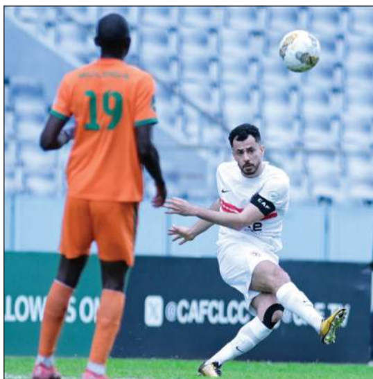
الزمالك لم يوفق أمام زيسكو الزامبي