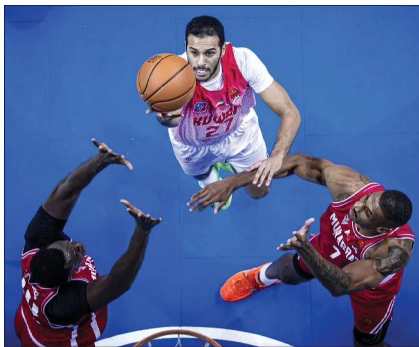
سهو السهو قدم مباراة جيدة أمام المحرق في المواجهة الأولى

وقد تفوق «الأبيض» في المواجهة الأولى 107-101 ويحتاج إلى تكرار فوزه اليوم، لضمان التأهل للمربع الذهبي، وفي حال فوز الفريق البحريني سيذهب الفريقان إلى مواجهة فاصلة في الـ 16 فبراير الجاري، لحسم هوية الفريق الذي سيلقي الاتحاد السعودي في نصف النهائي. ويسعى المدرب الصربي دوشان ستوجكوف إلى حسم المواجهة الثانية، لعدم