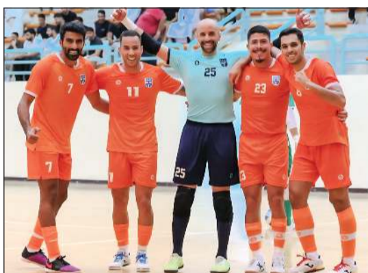
لاعب كاظمة في اختبار صعب أمام العربي اليوم