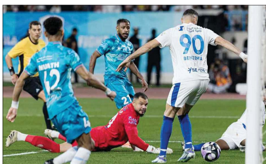
كريم بنزيمة سجل «هاتريك» في ظهوره الأول مع الهلال

الهلال يدخل المواجهة بثقة كبيرة، إذ لم يتعرض للخسارة في آخر 20 مباراة له في دور المجموعات بدوري أبطال آسيا للنخبة، في أطول سلسلة من هذا النوع في تاريخ البطولة، ومستفيداً من انتصاره الكبير في الدوري 6-0 على الأندوس في ظهور أول مميز لمهاجمه الجديد الفرنسي كريم بنزيمة الذي سجل «هاتريك»، بينما سيضمن شباب الأهلي بطاقة العبور إلى دور الـ 16 في حال تحقيقه الفوز.