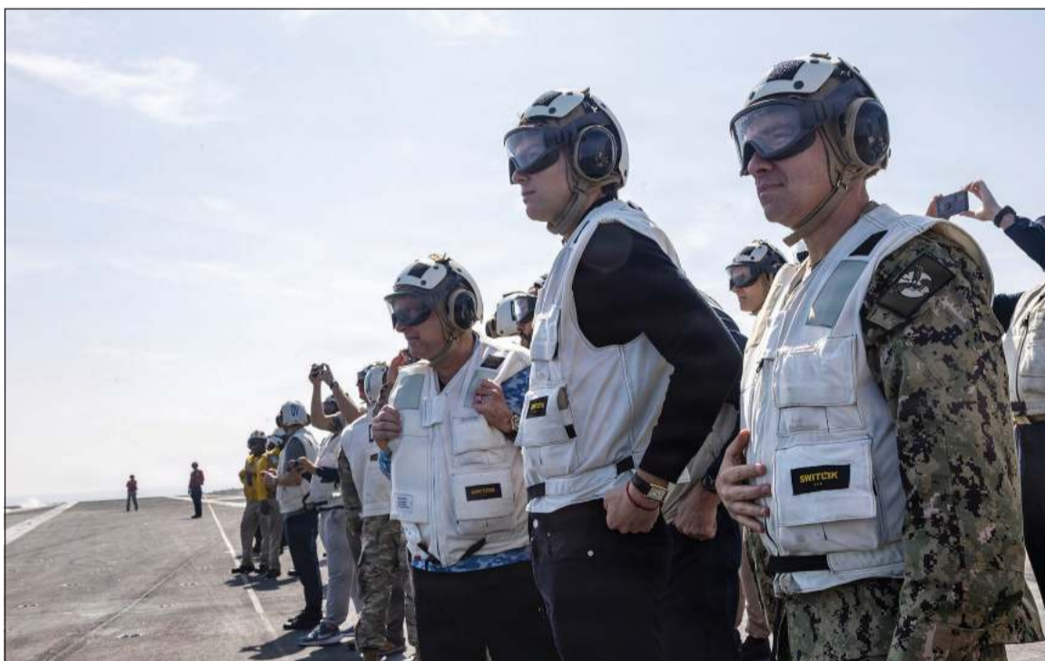
المبعوث الأميركي الخاص إلى الشرق الأوسط ستيف ويتكوف وجاريد كوشنر برفقة قائد القيادة المركزية الاميرال براد كوبر على متن حاملة الطائرات «أبراهام لينكولن»، أمس الأول

وقال الرئيس الإيراني مسعود يزشكيان عبر منشور في حسابه الرسمي على منصة (إكس) أمس إن المحادثات بين البلدين «كانت خطوة إلى الامام»، مشيرا إلى أن «الحوار كان دائما الاستراتيجية لحل النزاعات بشكل سلمي». وأضاف «منطقنا في الموضوع النووي مبني على الحقوق المتكافئة عليها في معاهدة حظر الانتشار النووي، والشعب الإيراني رد دائما على الاحترام بالاحترام، لكنه لا يطبق لغة القوة». من جهته، قال وزير الخارجية الإيراني عباس عراقجي الذي ترأس الوفد الإيراني إلى الشرق الأوسط ستيف ويتكوف وجاريد كوشنر برفقة قائد القيادة المركزية الاميرال براد كوبر على متن حاملة الطائرات «أبراهام لينكولن»، أمس الأول الدولية التي تخنق الاقتصاد الإيراني. وقال عراقجي «يخشون قنبلتنا النووية، بينما نحن لا نسعى إلى امتلاك واحدة».