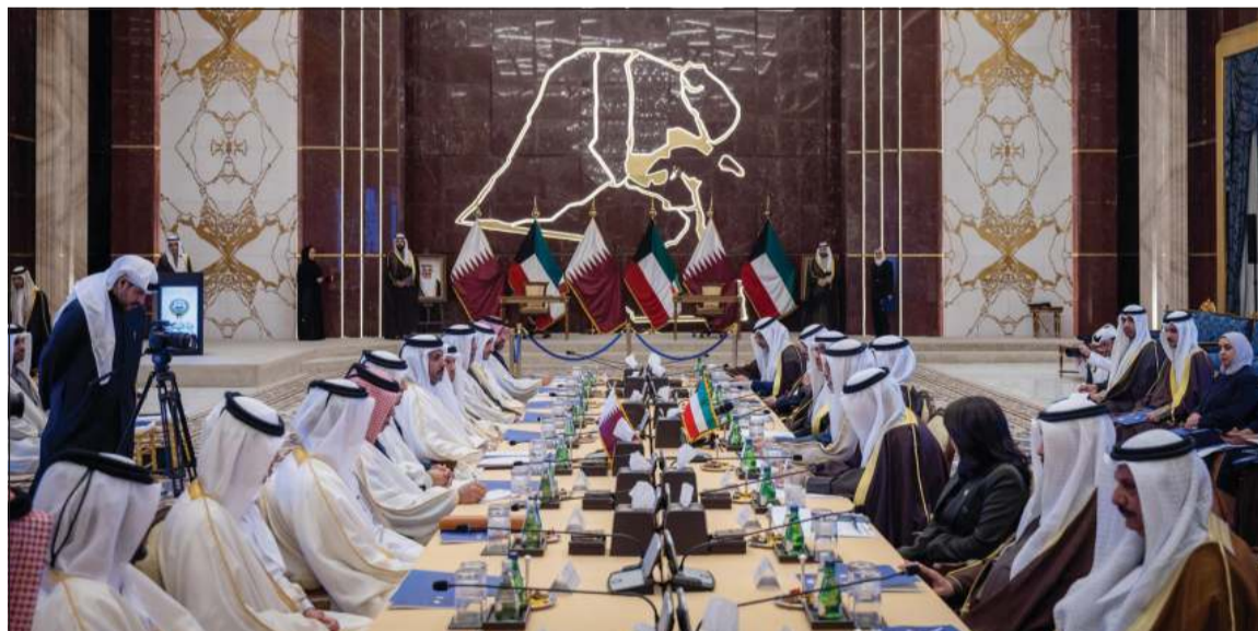
وزير الخارجية الشيخ جابر الأحمد ورئيس مجلس الوزراء وزير الخارجية الشيخ محمد بن عبد الرحمن بن جاسم آل ثاني خلال اجتماع الدورة السابعة للجنة العليا المشتركة للتعاون الكويتية - القطرية

وأكد أن هذا الاجتماع يأتي امتدادا لما تحقق في الدورات السابقة ويعكس حرص البلدين على تعزيز التعاون في مختلف المجالات والبناء على النتائج بما يخدم المصالح المشتركة. وأوضح أن هذا التعاون يحظى دعما وتوجيها من القيادتين الحكيمتين، مؤكدا أهمية مواصلة العمل المشترك وتحقيق تطلعات الشعبين الشقيقين. وتقدم بخالص التهاني لدولة الكويت بقرب حلول الذكرى الـ 65 لليوم الوطني والذكرى الـ 35 ليوم التحرير، متمنيا للبلاد مزيدا من الازدهار في ظل قيادتها الحكيمة.