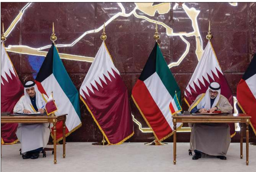
وزير الخارجية الشيخ جابر الأحمد ورئيس مجلس الوزراء وزير الخارجية الشيخ محمد بن عبد الرحمن بن جاسم آل ثاني خلال توقيع إحدى مذكرات التفاهم

رئيس الوزراء القطري: تتنم تطابق الرؤى مع الكويت حيال مختلف القضايا الإقليمية والدولية وتنتقل إلى مضاعفة التنسيق والتعاون في كل ما يهم شعوبنا الخليجية وأمتينا العربية والإسلامية والعالم