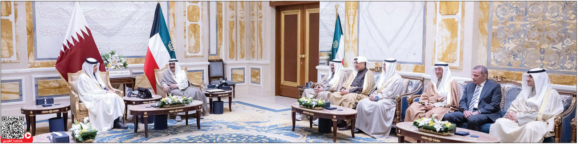
صاحب السمو الأمير الشيخ مشعل الأحمد مستقبلاً الشيخ محمد بن عبد الرحمن بن جاسم آل ثاني رئيس مجلس الوزراء وزير الخارجية بدولة قطر بحضور رئيس الوزراء سمو الشيخ أحمد العبدالله خلال جلسة المباحثات مع الشيخ محمد بن عبد الرحمن بن جاسم آل ثاني رئيس مجلس الوزراء وزير الخارجية الشيخ جابر الأحمد ووكيل مكتب صاحب السمو الأمير الفريقي متقاعد جمال الذياب ووكيل الشؤون الخارجية بالديوان الأميري مازن العيسى ووكيل الديوان الأميري الشيخ عبدالعزيز مشعل العبدالله