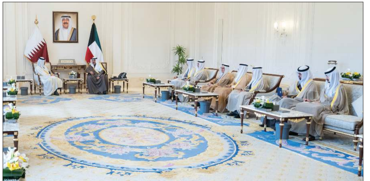
سمو ولي العهد الشيخ صباح الخالد خلال استقباله الشيخ محمد بن عبد الرحمن بن جاسم آل ثاني رئيس مجلس الوزراء وزير الخارجية بدولة قطر بحضور رئيس ديوان سمو ولي العهد الشيخ ثامر الجابر ووزير الخارجية الشيخ جابر الأحمد وكبار المسؤولين