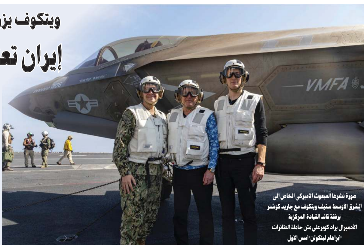
صورة نشرها المبعوث الأميركي الخاص إلى الشرق الأوسط ستيف ويتكوف مع جاريد كوشنر برفقة قائد القيادة المركزية الأميرال براد كوبر على متن حاملة الطائرات «أبراهام لينكولن» أمس الأول