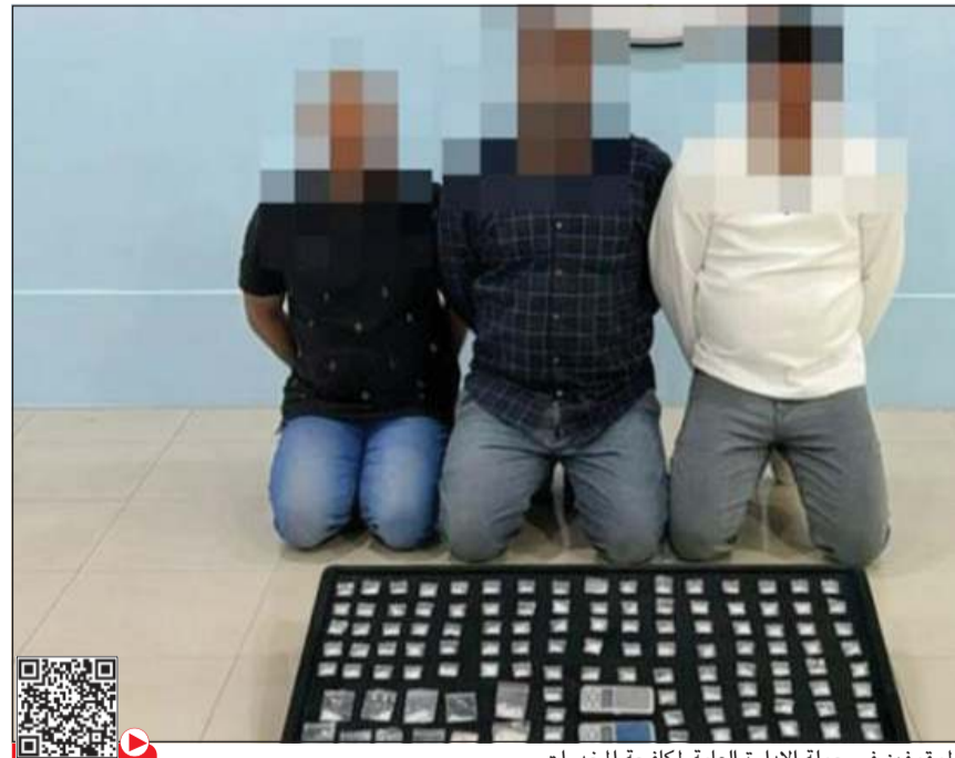
من بين المتهمين الموقعين في حملة الإدارة العامة لمكافحة المخدرات

أعلنت وزارة الداخلية عن تمكن الإدارة العامة لمكافحة المخدرات من ضبط 16 متهماً بحوزتهم كميات من المواد المخدرة، إلى جانب أدوات تستخدم في تجهيز وتوزيع المواد المخدرة. وذكرت «الداخلية» في بيان لها أن المضبوطات تمثلت في: 800 غرام الشبو، 745 غراماً من مادة الحشيش، إلى جانب 3 قطع أخرى، و151 غراماً من الكيميكال، و40 مل من زيت الكيميكال، و3 غرامات هيروين، و5000 قرص كبتاغون، مشيرة إلى أن المتهمين والمضبوطات تمت إحالتهم إلى الجهات المختصة لاتخاذ ما يلى من إجراءات قانونية وتدريبهم للمحاكمة وفقاً لقانون المخدرات الجديد بعقوبات مغلفة. وأكدت وزارة الداخلية استمرار حملاتها الأمنية المكثفة في مختلف المناطق، وعدم التعاون مع كل من تسول له نفسه الإضرار بأمن المجتمع من خلال الاتجار أو الترويج أو التعاطي للمواد المخدرة، داعية الجميع إلى التعاون والإبلاغ عن أي معلومات تسهم في مكافحة هذه الآفة الخطيرة، لما لذلك من دور فاعل في حفظ أمن المجتمع وسلامته.