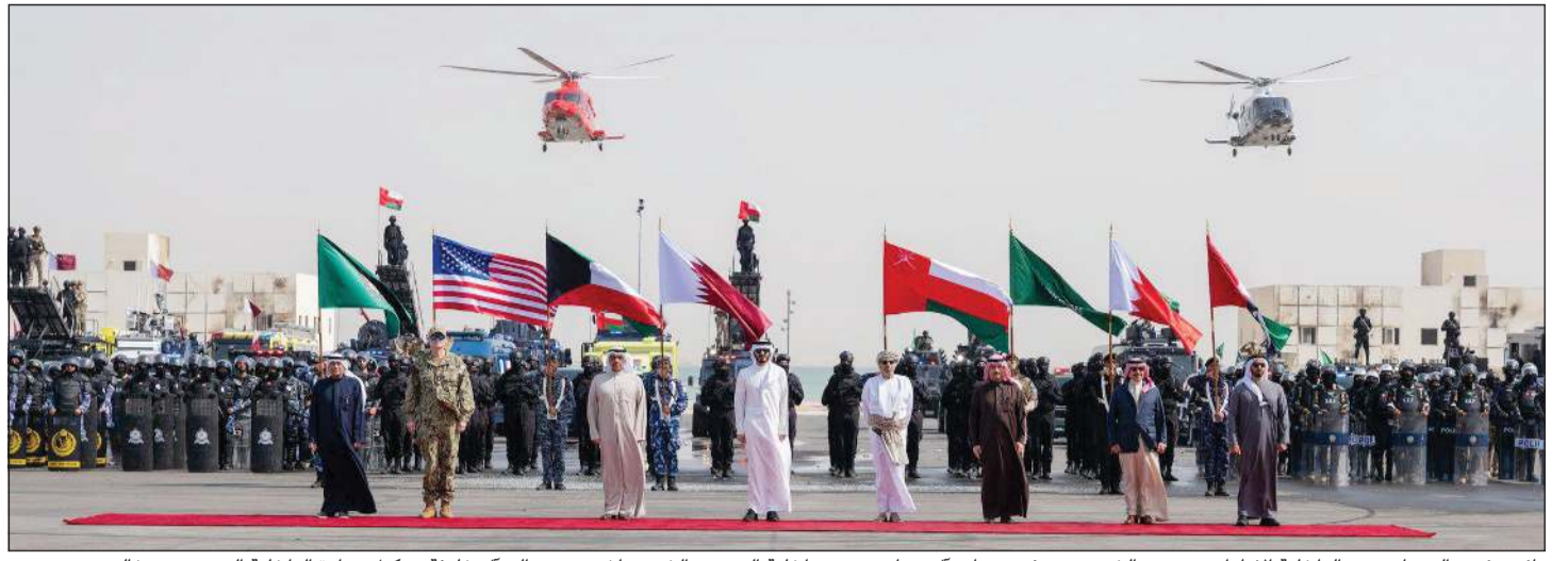
نائب رئيس الوزراء وزير الداخلية الإماراتي سمو الشيخ سيف بن زايد آل نهيان وزير داخلية البحرين الشيخ راشد بن عبدالله آل خليفة ووكيل وزارة الداخلية السعودي د. خالد بن محمد بن عبدالله ووزير الداخلية العماني حمود بن فيصل البوسعيدي ووزير داخلية قطر الشيخ خليفة بن حمد بن خليفة وممثل النائب الأول لرئيس مجلس الوزراء ووزير الداخلية الشيخ فهد اليوسف ووكيل وزارة الداخلية اللواء عبدالوهاب الوهيب الأمين العام لمجلس التعاون الخليجي جاسم البديوي في الحفل الختامي