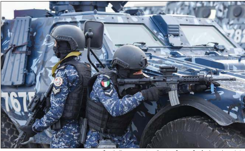
تنفيذ سيناريوهات أمنية متنوعة تهدف إلى رفع مستوى الجاهزية