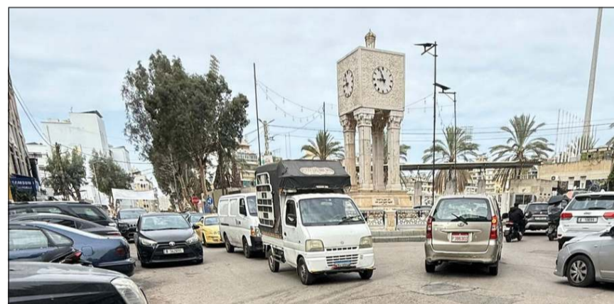
حركة في ساحة الملعب البلدي بالطريق الجديدة (محمود الطويل)

وللسادس من فبراير كحاية في بداية عهد الرئيس العماد جوزف عون عام 2025، إذ تعفرت ولادة حكومة العهد الأولى برئاسة الرئيس المكلف نواف سلام، لاعتراض الرئيس نبيه بري على إدراج سلام اسم مستشارته ليا مبيض السباط في التشكيلة الحكومية، فغادر بري القصر الجمهوري، على الرغم من المباشرة بالإعداد لمراسم ولادة الحكومة، التي شكلت بعد أيام من دون المبيض.