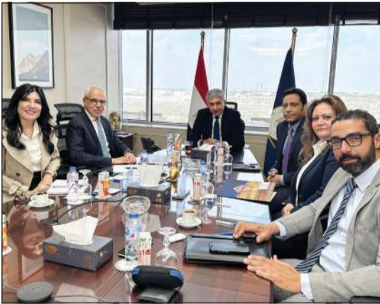
جانب من اجتماع ترأسه شريف فتحي وزير السياحة والآثار بمقر الوزارة بالعاصمة الجديدة لمناقشة خطة تسويقية متكاملة للمتحف القومي للحضارة المصرية