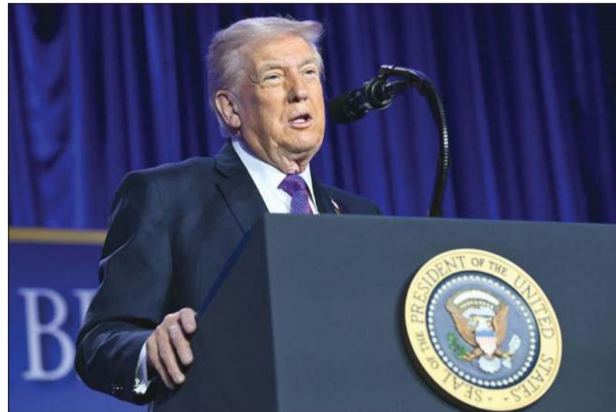
الرئيس الأميركي دونالد ترامب يتحدث خلال إفطار الصلاة الوطني

بدوره، قال وزير الخارجية الإيراني عباس عراقجي على حسابه الرسمي عبر منصة «إكس»، إن المحادثات النووية