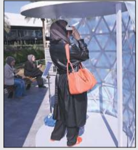
إحدى الحاضرات في غرفة الواقع الافتراضي