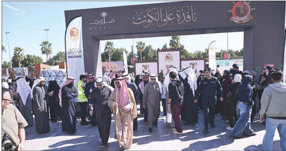
الشيخ صباح بدر السالم وم.محمد الخالدي خلال جولة في المعرض

من جانبه، أشاد المحافظ الشيخ صباح بدر السالم خلال جولته في المعرض بالمستوى الفني للأعمال المشاركة، منمناً جهود وزارة التربية والتوجيه الفني للتربية الفنية في إبراز طاقات الميدان التربوي.