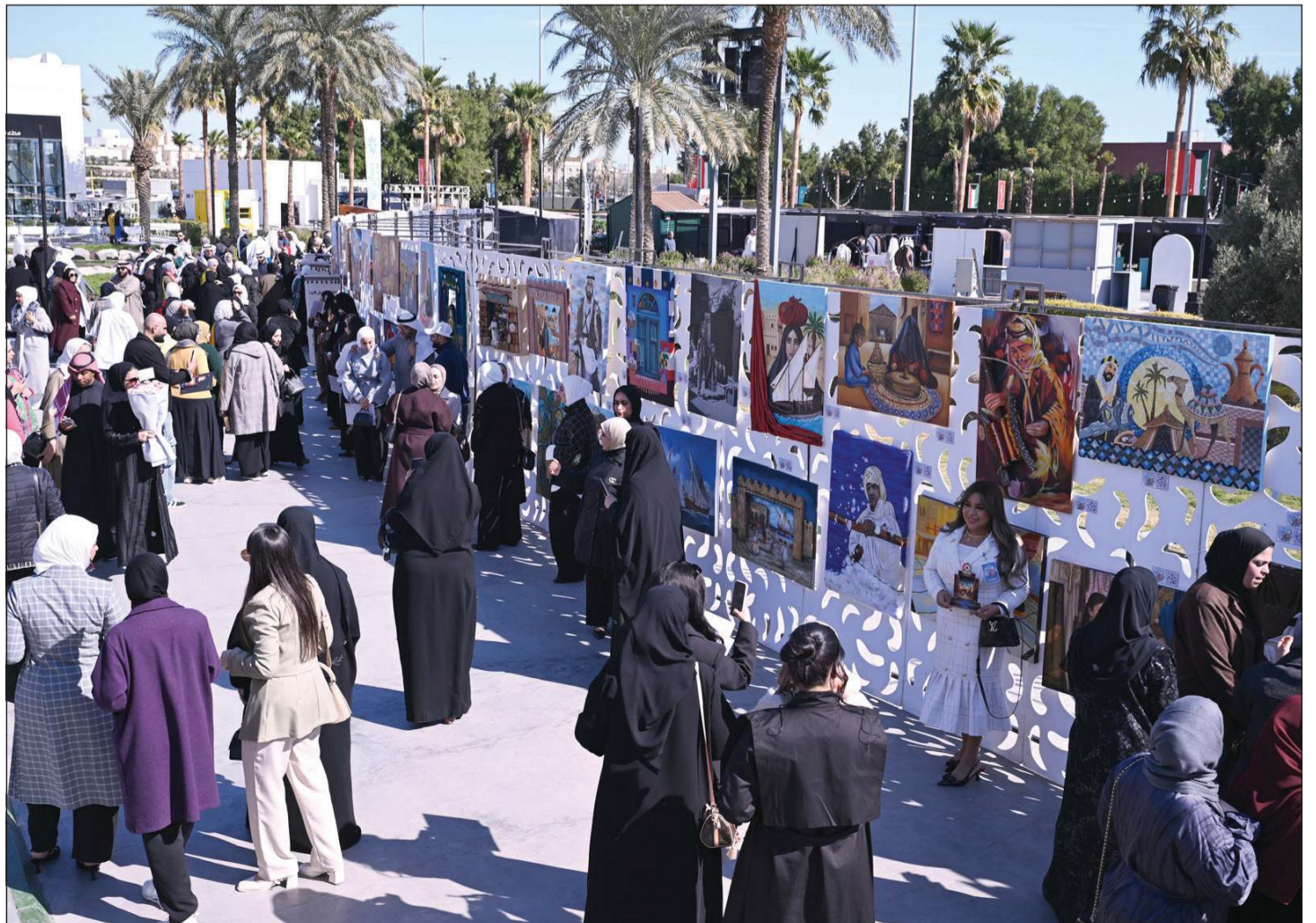
مشاركة أكثر من 115 معلماً ومعلمة من التوجيه الفني بلوحات إبداعية