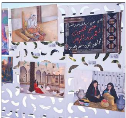
جانب من اللوحات