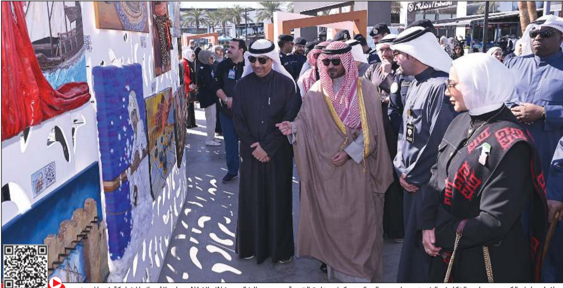
محافظ مبارك الكبير وحولي بالتكليف الشيخ صباح بدر السالم ووكيل وزارة التربية م.محمد الخالدي خلال الاطلاع على الاعمال المشاركة في المعرض