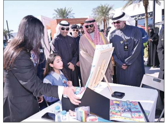
الشيخ صباح بدر السالم وم.محمد الخالدي يطلعان على أعمال إحدى الطالبات في جناح الرسم

إلى إبراز دور التوجيه الفني بالوزارة فب تعزيز الهوية الوطنية. ولفتت العلي إلى ان الفعالية تنظم بمشاركة جميع المناطق التعليمية، وذلك بأعمال جسدت الجانب الإبداعي الوطني من قبل معلمي ومعلمات التربية الفنية. ولفتت إلى أن اللوحات جسدت دور التربية الفنية في إبراز الهوية الوطنية وتعزيزها، شاكراً محافظة مبارك الكبير على التنظيم المميز للفعالية.