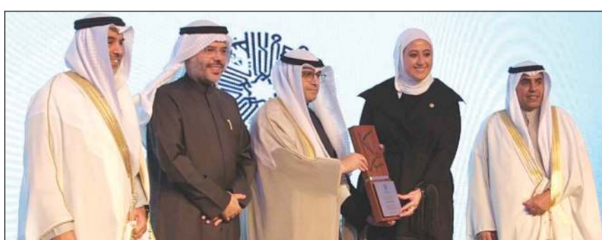
وزير الدولة لشؤون البلدية ووزير الدولة لشؤون الإسكان م.عبداللطيف المشاري مكرماً الصندوق الكويتي للتنمية

شركة إدارات العقارية - ذات مسؤولية محدودة إعلان تذكيري لحضور اجتماع الجمعيات العامة العادية عن السنة المالية المنتهية في 31 ديسمبر 2025 يتشرف مدير شركة إدارات العقارية - ذات مسؤولية محدودة بذكر وعصوة السادة / الشركاء لحضور إجتماع الجمعية العامة العادية للسنة المالية المنتهية في 31 ديسمبر 2025. المقررة انعقادها في يوم الخميس الموافق 2026/02/12، وذلك في تمام الساعة العاشرة صباحاً، وذلك في العنوان الكائن في الشرفى - شارع أحمد الجابر - قطعة 5 - قسيمة 24 - برج وربة - الدور السابع، وذلك لعامة المبررة على جدول الأعمال، وعليه يرجى من السادة / الشركاء الحضور بالوقت المحدد من يوم بنوب عنهم مراجعة إدارة الشركة على العنوان المذكور أعلاه وذلك خلال موعد العمل الرسمية من الأحد حتى الخميس من الساعة 9 صباحاً حتى الساعة 3 عصرًا، مصطحبين معهم التوكيلات أو التفويضات لمن بنوب عنهم في حالة الإزابة وذلك قبل موعد الاجتماع بأربع وعشرين ساعة على الأقل. ملحوظة: في حال عدم توافر نصاب الحضور المقرر قانوناً لصحة هذا الاجتماع، يُؤجل ذات جدول الأعمال إلى يوم الأحد الموافق 2026/02/15 في تمام الساعة العاشرة صباحاً وما يليها، وذلك في نفس مكان الاجتماع ويؤجل هذا الإعلان سارياً على الاجتماع المؤجل دون الحاجة لإجراءات الدعوة مرة أخرى. والله ولي التوفيق المدير العام