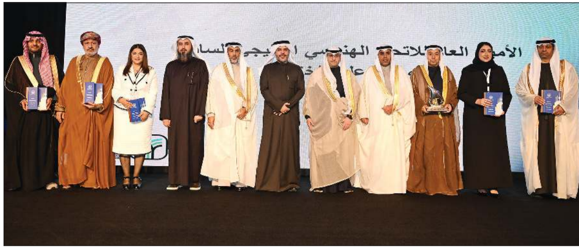
وزير الدولة لشؤون البلدية ووزير الدولة لشؤون الإسكان م.عبداللطيف المشاري ووكيل وزارة الشؤون دخالد العجمي ورئيس جمعية المهندسين م.محمد السبيعي وم.فيصل العتل مع ممثلي الوفود الخليجية والمشاركين في الملتقى الهندسي الخليجي الـ 27 (ريليش كومار)