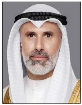
وزير الخارجية الشيخ جراح الجابر

وذكرت الخارجية، في بيان صحفي، إن المسؤول الليبي أعرب عن أطيح التمنيات بالتوفيق والسداد والتطلعات للعمل معا بشكل وثيق بما يسهم في تعزيز العلاقات الثنائية وخدمة المصالح المشتركة بين البلدين والشعبين الشقيقين. كما تلقى وزير الخارجية الشيخ جراح اتصالاً هاتفياً من المكلف بتسيير