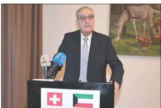
رئيس الاتحاد السويسري غي بارميلان متحدثاً خلال حفل السفارة السويسرية

أن هذه الزيارة تمثل دفعة لتحفيز استخدام تلك الاتفاقيات بشكل عملي. وأكد أن الاحتفال بمرور ستة عقود على العلاقات الدبلوماسية يعكس شراكة ناجحة ومستقرة، معرباً عن ثقته بأن المستقبل التعاون والنجاح المشترك. وختم بالتشديد على أن زيارته تهدف إلى إعطاء زخم إضافي لتفعيل الأطر القائمة وتشجيع الشركات على الاستفادة منها، بما في ذلك العلاقات الاقتصادية والاستثمارية بين البلدين. وقال سفير سويسرا لدى الكويت تيزيانو بالميلي إن السفارة تشرف على استضافة هذه المناسبة بالتزامن مع زيارة رئيس الاتحاد السويسري، احتفاءً بمرور 60 عاماً على إقامة العلاقات الدبلوماسية بين البلدين.