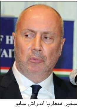
سفير هنغاريا أندراش سابو

تطلع بلاده إلى أن تكون شريكاً فاعلاً في هذا المشهد الحيوي. ونظمت بالتعاون مع مركز هنغاريا للتسويق الزراعي، وهو جهة حكومية معنية بالترويج للمنتجات الزراعية والغذائية الهنغارية، لافتاً إلى أن محدودية توافر المنتجات الهنغارية في الأسواق الكويتية كانت من أبرز الدوافع لإطلاق الحدث، الذي يعد الأول من نوعه بين البلدين.