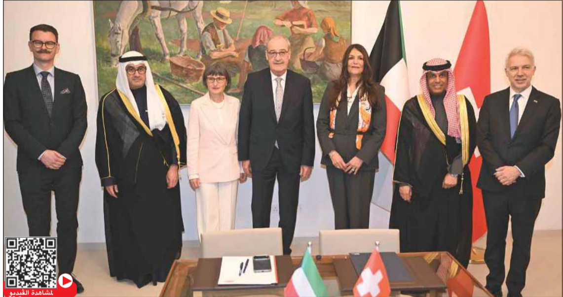
رئيس الاتحاد السويسري غي بارميلان وحرمه ود. خالد الفاضل والسفير صادق معرفي والسفير السويسري تيزيانو بالميلي (أحمد علي)

■ التركيز ينصب على تعزيز التواصل بين القطاع الخاص في البلدين وربط الشركات والقطاعات الصناعية ■ الحوار الإستراتيجي بين دول مجلس التعاون الخليجي وسويسرا سيعقد قريباً في إطار الأطر القائمة