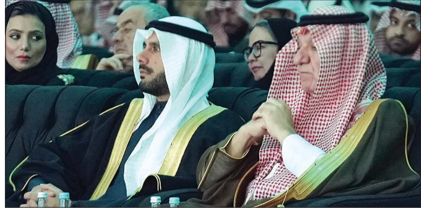
الشيخ مبارك فهد الجابر خلال مشاركة في المنتدى السعودي للإعلام

المصاحب للمنتدى، وذلك ضمن توجهها لدعم الفعاليات الإعلامية الخليجية وتعزيز حضورها بين المؤسسات الإعلامية الفاعلة في المنطقة. ولفت إلى أن جناح المؤسسة يستعرض جانباً من أعمالها وبرامجها التي تعكس الهوية الخليجية المشتركة إلى جانب التعريف بمجموعة من