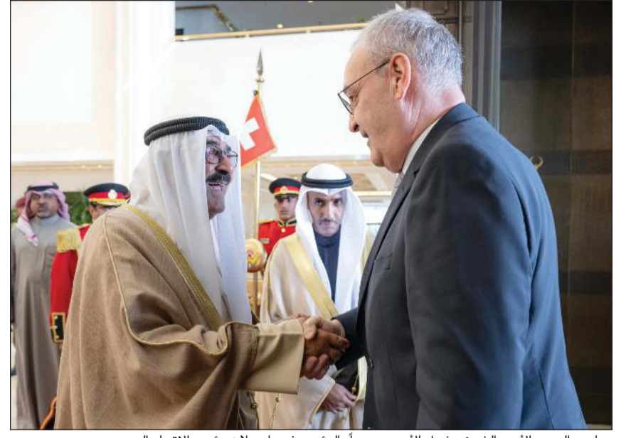
صاحب السمو الأمير الشيخ مشعل الأحمد مرحباً بالرئيس في بارميلان رئيس الاتحاد السويسري

صاحب السمو والرئيس في بارميلان ناقشا العلاقات الثنائية وسبل دعمها وتنميتها في شتى المجالات وتوسيع أطر التعاون نحو آفاق أرحب