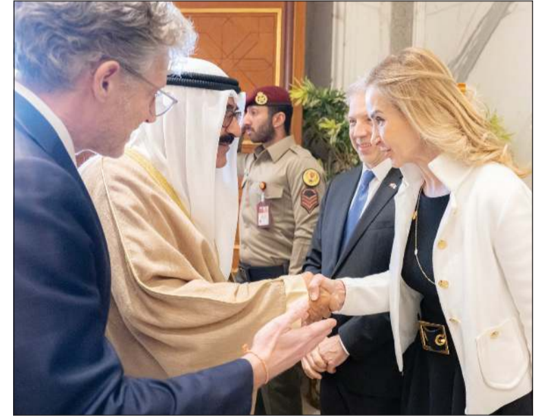
صاحب السمو الأمير الشيخ مشعل الأحمد مصافحاً الوفد المرافق للرئيس السويسري