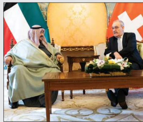
الرئيس في بارميلان رئيس الاتحاد السويسري مستقبلاً سمو الشيخ ناصر المحمد

كونا: استقبل الرئيس في بارميلان رئيس الاتحاد السويسري الصديق سمو الشيخ ناصر المحمد، وذلك في مقر إقامته بقصر بيان. حضر المقابلة المستشار بديوان سمو رئيس مجلس الوزراء رئيس بعثة الشرف المرافقة الشيخ دباسل الصباح ومساعد وزير الخارجية لشؤون أوروبا السفير صادق معرفي.