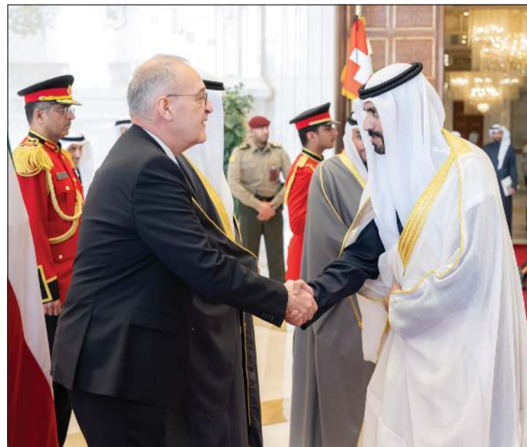
الشيخ دمشعل الجابر مرحباً بضيف الكويت