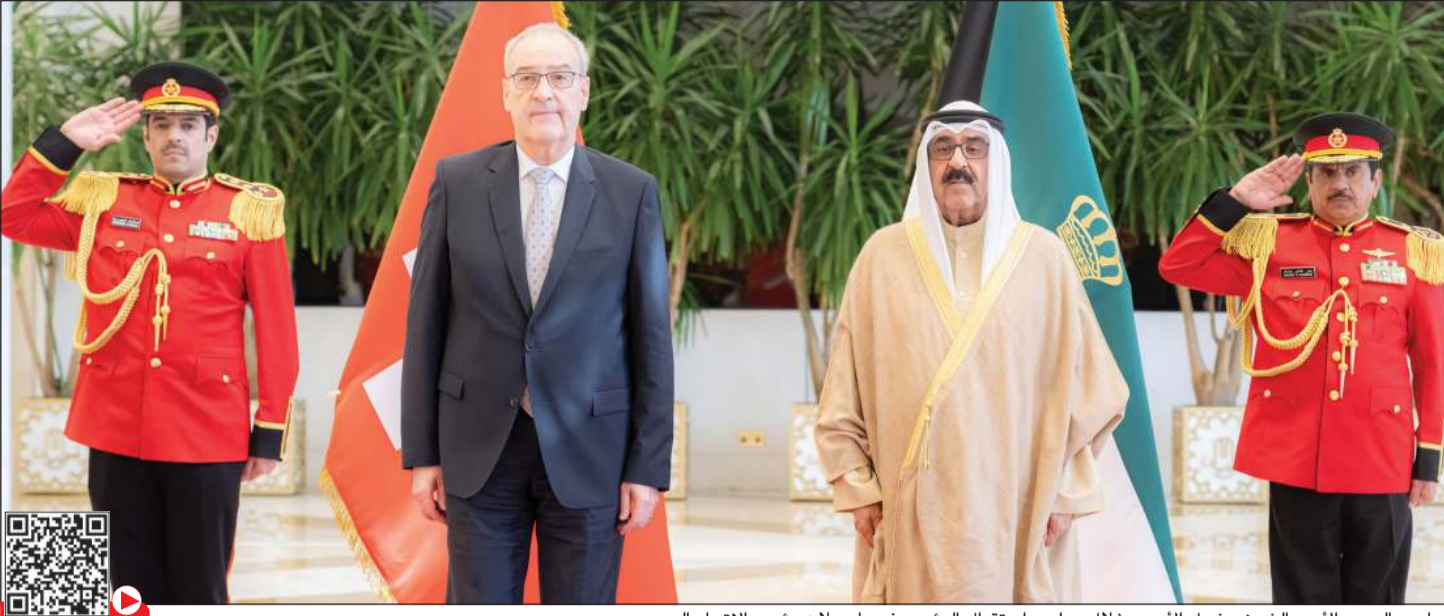
صاحب السمو الأمير الشيخ مشعل الأحمد خلال مراسم استقبال الرئيس في بارميلان رئيس الاتحاد السويسري