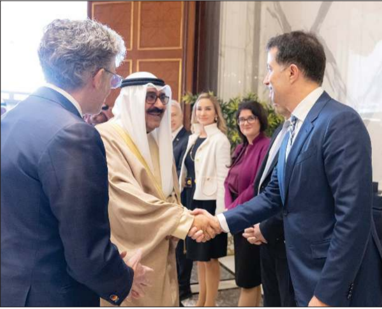
صاحب السمو الأمير الشيخ مشعل الأحمد مصافحاً أعضاء الوفد السويسري