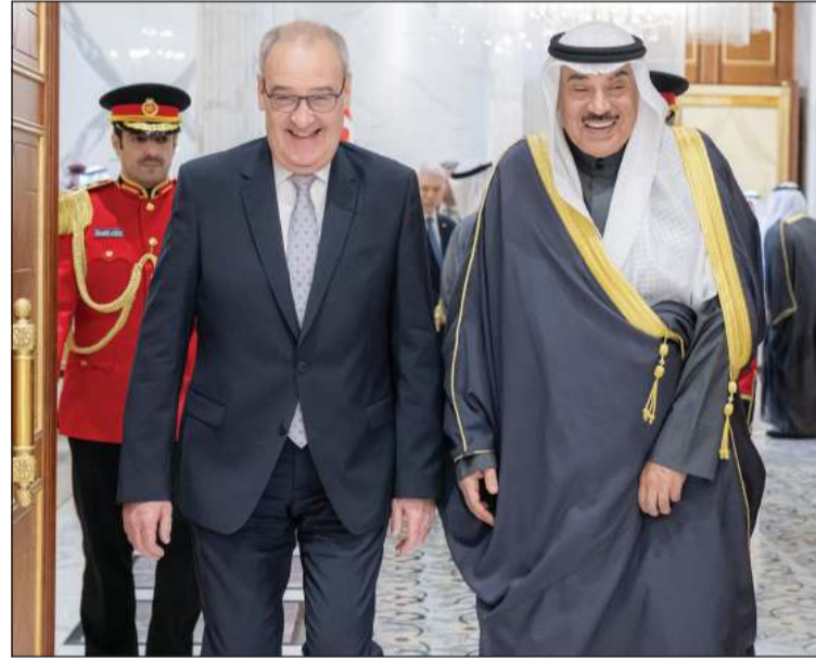
سمو ولي العهد الشيخ صباح الخالد خلال اللقاء مع رئيس الاتحاد السويسري