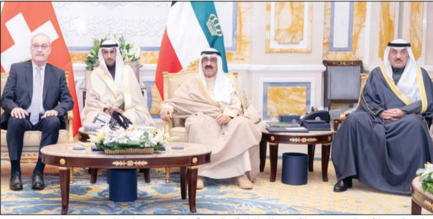
صاحب السمو الأمير الشيخ مشعل الأحمد خلال المباحثات الرسمية مع الرئيس في بارميلان رئيس الاتحاد السويسري بحضور سمو ولي العهد الشيخ صباح الخالد

رئيس الاتحاد السويسري: ما يجمع الكويت وسويسرا علاقات تعاون تقوم على الاحترام المتبادل والقيم المشتركة وحريصون على تعزيزها في مختلف المجالات