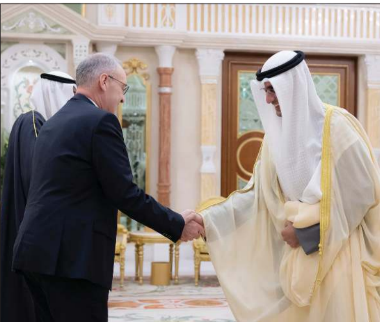
الشيخ سعود سالم العبد العزيز مصافحاً ضيف الكويت