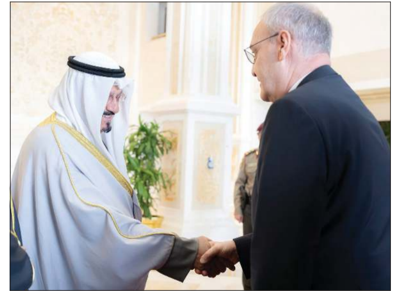
رئيس الوزراء سمو الشيخ أحمد عبدالله مصافحاً ضيف الكويت