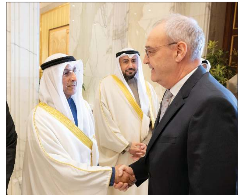
الفريق جمال الذياب والشيخ دباسل الصباح في استقبال الرئيس السويسري