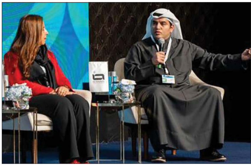
جانب من جلسات النقاش المتقدمة حول الذكاء الاصطناعي والابتكار