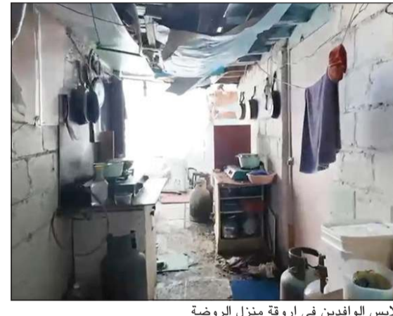
ملابس الوافدين في اروقة منزل الروضة