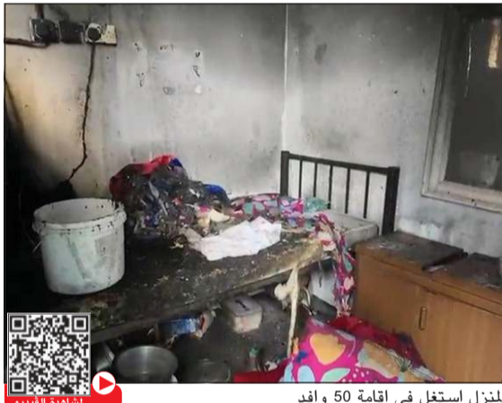
المنزل استغل في إقامة 50 وافد

الوزارة دعت إلى الإبلاغ عن أي منزل يشبه باستخدامه كسكن للعزاب أو العمال داخل المناطق السكنية