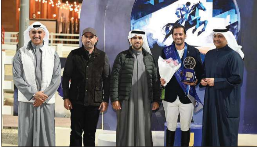
وكيل وزارة الداخلية اللواء عبدالوهاب الوهيب يسلم درعا لآحد الفائزين بحضور رئيس اللجنة الأولمبية الكويتية الشيخ فهد ناصر صباح الأحمد والمعبد ركن بحري الشيخ مبارك يوسف