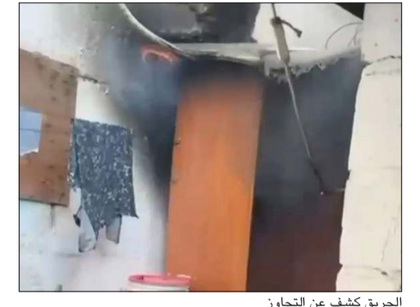
الحريق كشف عن التجاوز

مخفر المنطقة أو الاتصال على عمليات الأمن العام (96643983)، مؤكدة أن هذا التعاون يساهم في دعم الجهود الوقائية وترسيخ مفهوم الشراكة المجتمعية والمحافظة على أمن وسلامة المناطق السكنية.