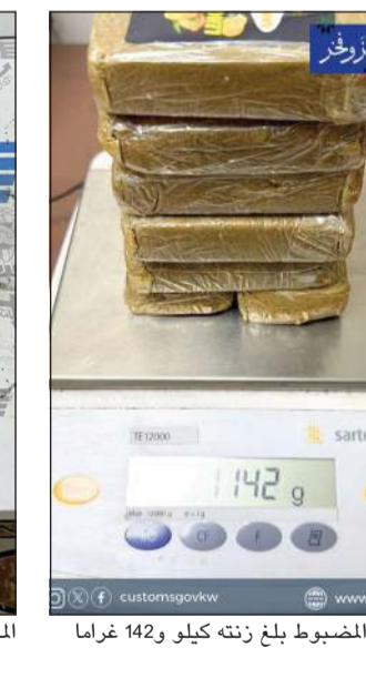
الحشيش المضبوط بلغ زنته كيلو و142 غراما

تمكنت مراقبة تفتيش البضائع بجمارك الشحن الجوي من ضبط شحنة مشتبه بها قادمة من المملكة المتحدة وموجهة إلى مطار الكويت الدولي عبر الترانزيت. وأوضحت «الجمارك»، في بيان صادر عنها، أن عملية الضبط جاءت بعد الاشتباه في الشحنة أثناء إجراءات التفتيش، حيث تبين احتواؤها على مخدرات - راتنج القنب (حشيش)، بكمية بلغت 12 قطعة وبوزن إجمالي يقارب 1,142 كيلوغرام، كانت مخبأة داخل الشحنة. وأكدت الإدارة العامة للجمارك أنه تم اتخاذ الإجراءات القانونية اللازمة وإعداد محضر الضبط وإحالة الواقعة إلى الجهات المختصة لاستكمال الإجراءات وفق الأنظمة المعمول بها. وشددت «الجمارك» على استمرار جهودها في إحكام الرقابة على المنافذ، والتصدي لأي محاولات تهريب تمس أمن الوطن وسلامة المجتمع، وذلك بالتعاون والتنسيق مع الجهات الأمنية المعنية.