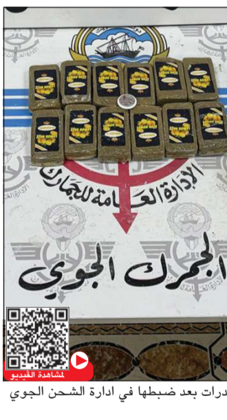
المخدرات بعد ضبطها في إدارة الشحن الجوي