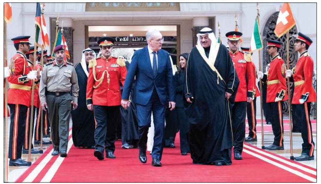
سمو ولي العهد الشيخ صباح الخالد مستقبلاً رئيس الاتحاد السويسري غي بارميلان