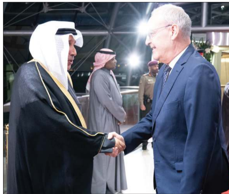
وزير الديوان الأميري الشيخ حمد جابر العلي مرحباً بصيف الكويت