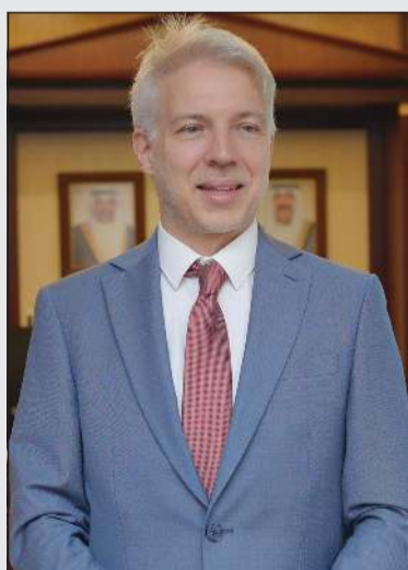
سفير سويسرا تيزيانو بالميلي