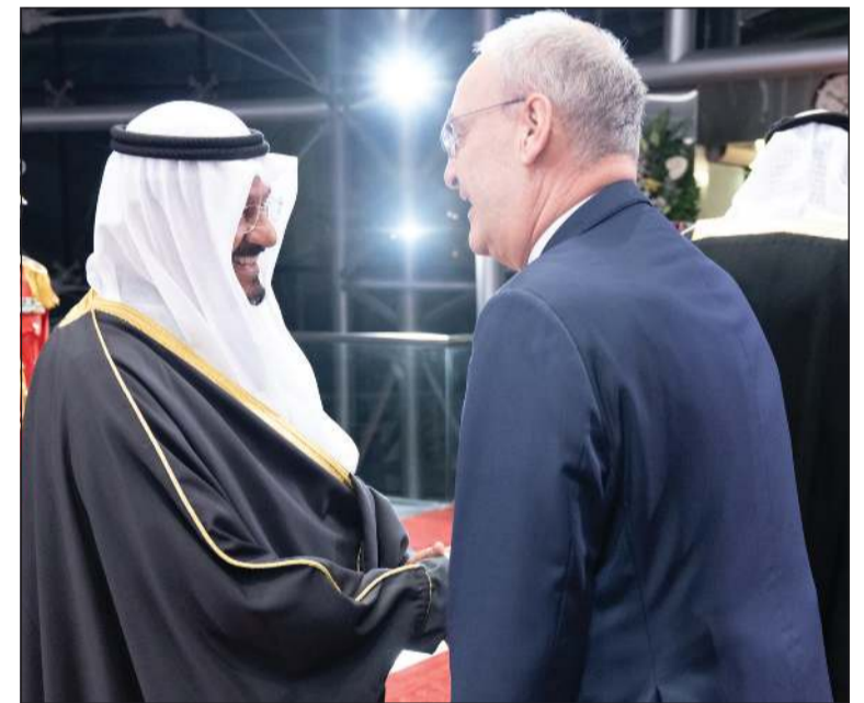
رئيس الوزراء سمو الشيخ أحمد عبدالله مصافحاً الرئيس السويسري