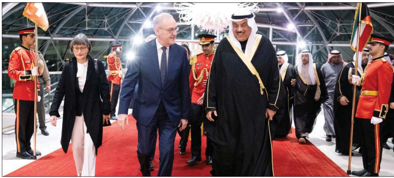
سمو ولي العهد الشيخ صباح الخالد خلال استقباله الرئيس غي بارميلان رئيس الاتحاد السويسري لدى وصوله إلى البلاد