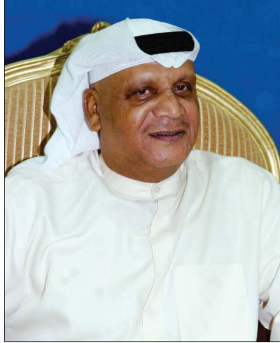
الراحل فتحي كميل

كان لاعبا لم تجد الملاعب بمثله، ولن تجود، وهذه ليس شهادة محب وصديق، بل شهادة أدلى بها خبراء كرة القدم، ومن بينهم من توجهوا بكأس العالم لكرة القدم من مدرين جالوا في مسيرتهم التدريبية العالم، وقد نال المجد بمسيرته الرياضية العطرة من كل جوانبه، وحقق إلى جانب إخوانه اللاعبين العبيد من الإنجازات الكبيرة التي كانت ولا تزال رائدة في تاريخ الرياضة الكويتية والخليجية والعربية، أما فتحي كميل، فكانت أسمى صفه، ويصعب معه اختيار الكلمات المناسبة التي من شأنها أن توفيه حقه وما يستحقه، فهو رجل عطر الحديث، سمح الوجه والخلق، مدرسة في الوفاء والولاء، ولطالما قدم السند والمشورة للعديد من أبناء الوسط الرياضي ومنهم هم خارجة، وعزأونا الوحيد بأن تلك المسيرة العطرة لاعبا وشخصا، ستمتد ذكرا خالدا عبر الأجيال». واختتم الحوطي قائلاً «رفيق الشرب.. ستبقى خالدا في وجدان أهل الكويت الأوفياء، وستبقى إنجازاتك الكبيرة التي سطرته مع إخوانك اللاعبين بجد واجتهاد كبيرين، وروح العالية التي تسامت وارتقت لتحلق عاليا في سماء الخالدين تتحدث عنك لتثير المسيرة لأبناء الكويت الرياضيين.. وقدوة ومثالا يحتذى».