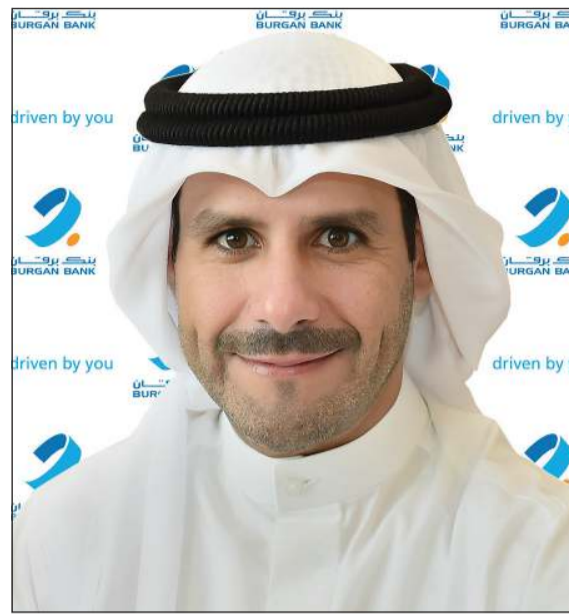
الشيخ عبدالله ناصر صباح الأحمد

التمويل المستقر (NSFR) 112%، ما يعد أعلى بكثير من الحد الرقابي البالغ 100%.