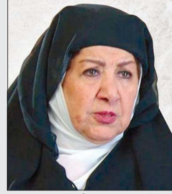
الراحلة هدى شعراوي «أم زكي»

فُجِع الوسط الفني السوري خصوصاً والعربي عموماً، نبأ مقتل الفنانة هدى شعراوي المعروفة بشخصية أم زكي في مسلسل «باب الحارة» الشهير، وإحدى قلمات الجيل المؤسس للدراما السورية. وقالت وزارة الداخلية السورية، في بيان عبر صفحاتها الرسمية: شهد حي باب سريجة في دمشق حادثة قتل مأساوية، حيث عثر على المواطنة هدى شعراوي مقتولة داخل منزلها. وأعلنت أن وحدات الأمن الداخلي وفرق المباحث الجنائية باشرت الإجراءات القانونية اللازمة، التي شملت تطويق موقع الحادث، وجمع الأدلة الجنائية وتحليلها، وتوثيق جميع المطبات الميدانية، إلى جانب فتح تحقيق موسع لكشف ملابسات الجريمة. من جهتها، قالت صحيفة «الثورة» السورية أن فرع المباحث الجنائية في