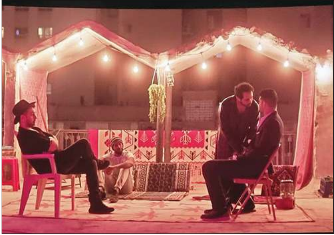
من مشاهد الفيلم

الفيلم الشبابي الحريص على تقديم فيلم يحمل بين طياته العديد من الرسائل الاجتماعية والإنسانية للمحافظة على تماسك الأسرة من المتغيرات التي تحدث حولنا. وقد نجح فريق العمل في جذب الحضور لمناجاة أحداث الفيلم بأسلوب مبتكر وبرؤية مختلفة من خلال توزيع أحداثه على 5 فصول، كل فصل يحمل عنواناً عربياً، لتجد هذا العنوان مطبقاً على مشاهد هذا الفصل، وهذا الأمر سهل على الحضور الاندماج مع قصة الفيلم الاجتماعية خصوصاً والإنسانية، خصوصاً أن تصوير مشاهد الفيلم