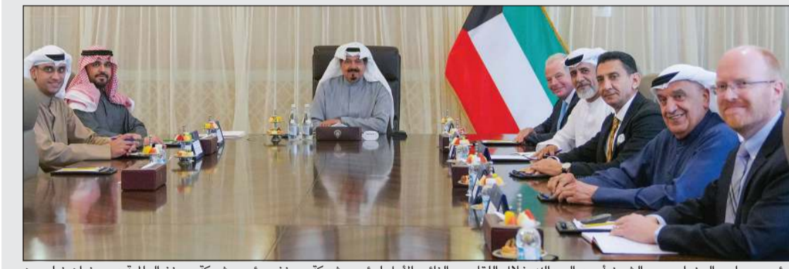
رئيس مجلس الوزراء سمو الشيخ أحمد عبدالله خلال اللقاء مع النائب الأول لرئيس شركة بويغ ورئيس شركة بويغ العالمية د.بريندان نيلسون ورئيس شركة بويغ لمنطقة الشرق الأوسط وشمال أفريقيا فهد المهيري

■ الوقوف على آخر المستجدات والعمل على تسريع الإجراءات والخطوات التنفيذية التي اتخذتها الوزارات والجهات المعنية مع الجهات الحكومية في جميع الدول ■ تعاون مستمر وتنسيق مشترك مع الحكومات يعكس التزام الكويت القوي والجاد بتعزيز علاقاتها الإستراتيجية وتعميق الروابط الاقتصادية بينها وبين الدول