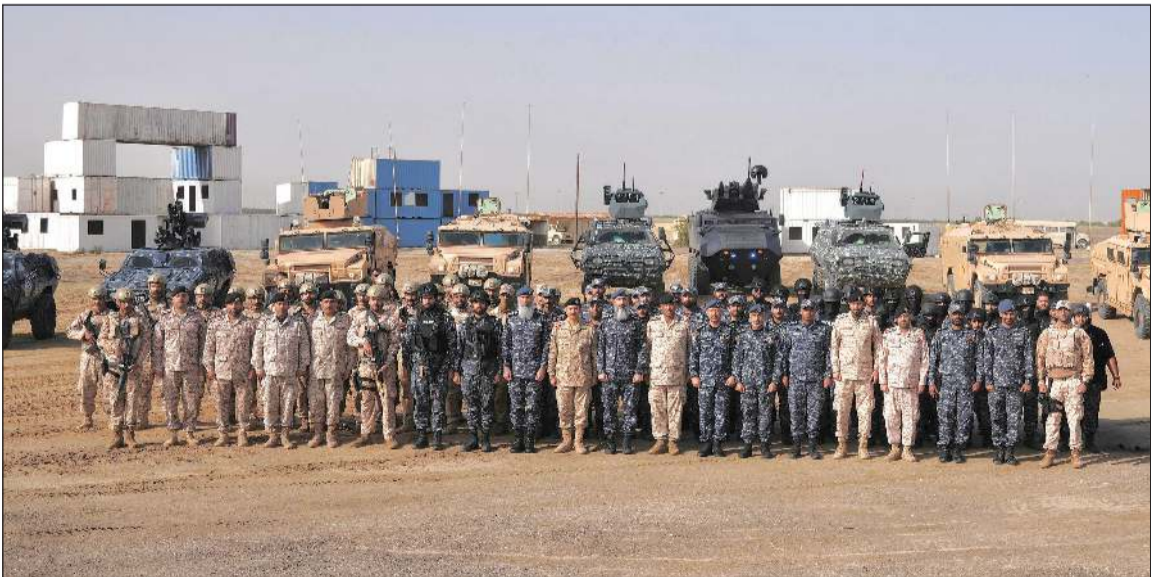
صورة جماعية للمشاركين في تمرين «درع الوطن 3»

اختتمت فعاليات تمرين «درع الوطن 3»، الذي انعقد في لواء صالح المحمد الآلي 94، بمشاركة وزارة الداخلية.