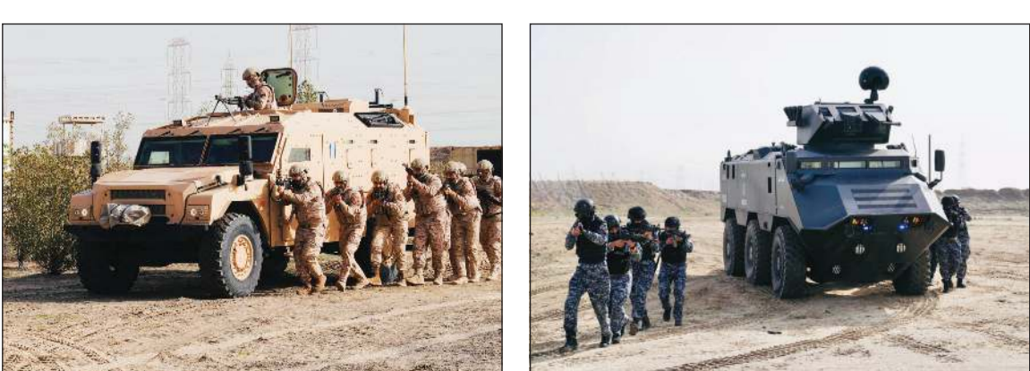
التمرين يستهدف تعزيز التكامل والتنسيق بين الجهات العسكرية والأمنية

اختتمت فعاليات تمرين «درع الوطن 3»، الذي انعقد في لواء صالح المحمد الآلي 94، بمشاركة وزارة الداخلية.