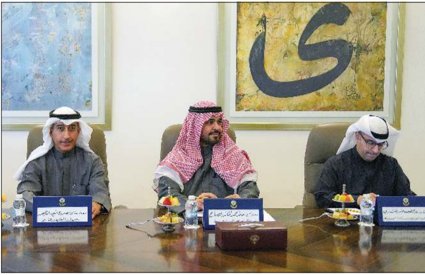
سمو الشيخ أحمد عبدالله رئيس مجلس الوزراء مترئسا في قصر بيان اجتماع اللجنة الوزارية الـ 45 لمتابعة تنفيذ المشاريع التنموية الكبرى في البلاد بحضور وزير الدولة لشؤون البلدية ووزير الدولة لشؤون الإسكان عبداللطيف المشاري ورئيس ديوان سمو رئيس مجلس الوزراء سمو رئيس مجلس الوزراء بالإتابة الشيخ خالد محمد الخالد ورئيس مجلس إدارة الجهاز المركزي للمنافسات العامة عصام المرزوق ورئيس إدارة الفتوى والتشريع المستشار صلاح الماجد ووكيل وزارة الكهرباء والماء والطاقة المتجددة د.عادل الزامل