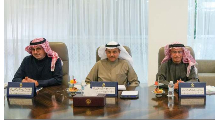
وزير الكهرباء والماء والطاقة المتجددة ووزير المالية ووزير الدولة للشؤون الاقتصادية والاستثمار بالوكالة د.صبيح المخيزيم ورئيس مجلس إدارة الجهاز المركزي للمنافسات العامة عصام المرزوق ووكيل وزارة الكهرباء والماء والطاقة المتجددة د.عادل الزامل

كونا: استقبل سمو الشيخ أحمد عبدالله رئيس مجلس الوزراء، في قصر بيان، النائب الأول لرئيس شركة بويغ العالمية ورئيس شركة بويغ لمنطقة الشرق الأوسط وشمال أفريقيا فهد المهيري، والوفد المرافق لهما، وذلك بمناسبة زيارتهم للبلاد، وجرى خلال اللقاء بحث سبل التعاون بين الكويت وشركة بويغ وفتح آفاق أوسع في مجال تطوير قطاعات صناعة واستيراد الطائرات والأبحاث الفضائية وتأهيل الكوادر المحلية بما يعزز الكفاءة الوطنية ويدعم رؤية البلاد التنموية.