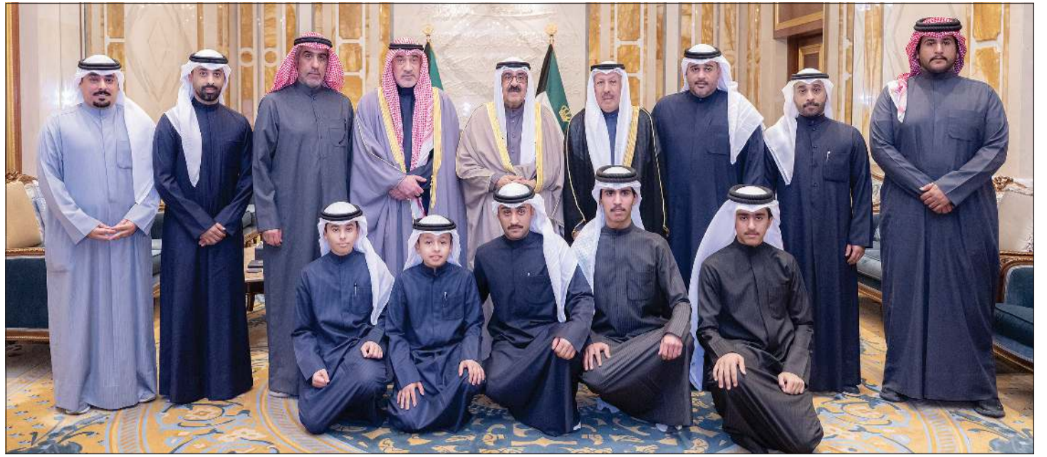
صاحب السمو الأمير الشيخ مشعل الأحمد مستقبلاً النائب الأول لرئيس مجلس الوزراء ووزير الداخلية الشيخ فهد اليوسف وأهالي شهيدى الواجب العقيد سعود نصار الخمسان والرفيق محمد سعد الهاجري

صاحب السمو وسمو ولي العهد استقبالاً النائب الأول ورئيس مجلس الوزراء ووزير الداخلية الشيخ فهد اليوسف وأهالي شهيدى الواجب العقيد سعود نصار الخمسان والرفيق محمد الهاجري وتسلماً كتاب «الكويت في 400 عام»