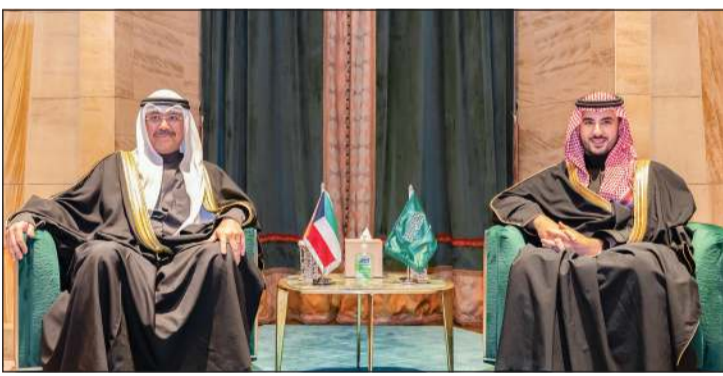
وزير الدفاع الشيخ عبدالله العلي خلال اللقاء مع صاحب السمو الملكي الأمير خالد بن سلمان بن عبدالعزيز آل سعود

التقى وزير الدفاع الشيخ عبدالله العلي بصاحب السمو الملكي الأمير خالد بن سلمان بن عبدالعزيز آل سعود، وزير الدفاع في المملكة العربية السعودية الشقيقة، مساء أمس، وذلك في إطار زيارته للمملكة العربية السعودية. حيث تم خلال اللقاء بحث العلاقات الثنائية الأخوية، وأوجه تعزيز التعاون في المجال الدفاعي والعمل بين البلدين الشقيقين، كما تم خلال اللقاء استعراض العديد من المستجدات على الساحة الإقليمية، والمواضيع ذات الاهتمام المشترك. وكان وزير الدفاع الشيخ عبدالله العلي والوفد المرافق له غادر إلى المملكة العربية السعودية الشقيقة وذلك في زيارة رسمية.