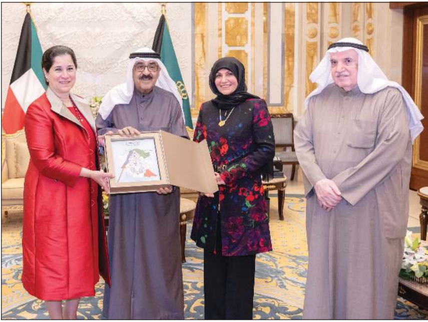
صاحب السمو الأمير الشيخ مشعل الأحمد يتسلم كتاب «الكويت في 400 عام» من الشقيقة انتصار سالم العلي ورئيس مركز البحوث والدراسات الكويتية د.عبدالله الغنيم ورقية علي حسين