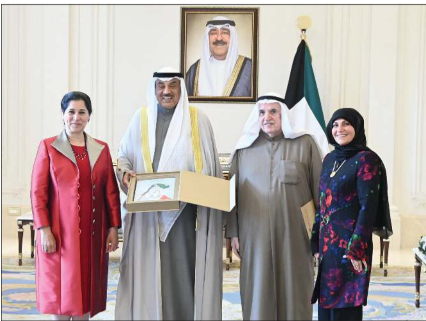
سمو ولي العهد الشيخ صباح الخالد خلال استقبال النائب الأول لرئيس مجلس الوزراء ووزير الداخلية الشيخ فهد اليوسف وأهالي شهيدى الواجب العقيد سعود نصار الخمسان والرفيق محمد سعد الهاجري