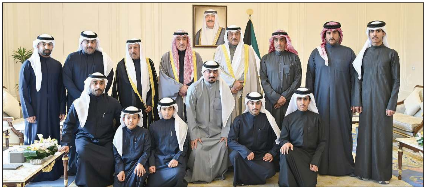
سمو ولي العهد الشيخ صباح الخالد خلال استقبال النائب الأول لرئيس مجلس الوزراء ووزير الداخلية الشيخ فهد اليوسف وأهالي شهيدى الواجب العقيد سعود نصار الخمسان والرفيق محمد سعد الهاجري

وأن ينزلها منازل الشهداء. كما استقبل سمو ولي العهد الشيخ صباح الخالد، في قصر بيان، الشقيقة انتصار سالم العلي ورئيس مركز البحوث والدراسات الكويتية د.عبدالله الغنيم ورقية علي حسين، حيث أهدوا سموه، حفظه الله، كتاباً حمل عنوان «الكويت في 400 عام».