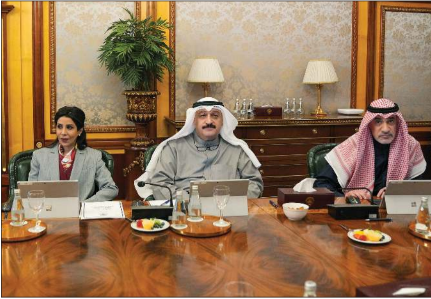
النائب الأول لرئيس مجلس الوزراء ووزير الداخلية الشيخ فهد اليوسف ود.أحمد العوضي ود.شيرة المشعان