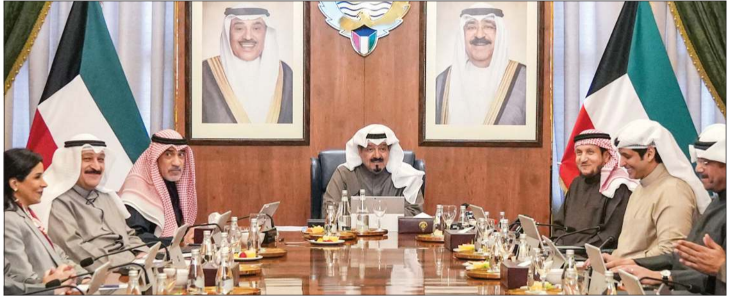
رئيس الوزراء سمو الشيخ أحمد العبدالله مقرئاً جلسة مجلس الوزراء

مجلس الوزراء: مراسم رفع العلم ستقام الأحد 1 فبراير في قصر بيان إيداناً ببدء احتفالات الكويت بالذكرى الـ 65 للعيد الوطني والذكرى الـ 35 ليوم التحرير