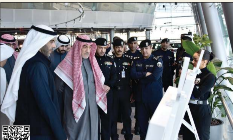
النائب الأول لرئيس مجلس الوزراء ووزير الداخلية الشيخ فهد اليوسف ورئيس مجلس إدارة شركة علي الغانم وأولاده للسيارات فهد الغانم خلال تسلم عدد من الدوريات الحديثة

كونا: تسلمت وزارة الداخلية عددا من الدوريات الحديثة المخصصة لها، بحضور النائب الأول لرئيس مجلس الوزراء ووزير الداخلية الشيخ فهد اليوسف، وذلك في إطار مبادرة مجتمعية مقدمة من شركة علي الغانم وأولاده. وذكرت «الداخلية»، في بيان صحفي، أن تسلم هذه الدوريات جاء بعد موافقة مجلس الوزراء وتجسيدها للتكامل والتعاون البناء بين مؤسسات الدولة والقطاع الخاص، بما يساهم في دعم الجهود الأمنية وتعزيز قدرات الدوريات في أداء مهامها.