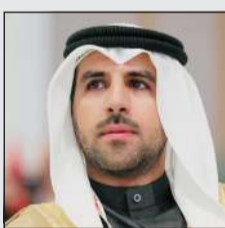
الشيخ فهد الناصر

فهد الناصر نائبا لرئيس «الأولمبي الآسيوي» عن منطقة غرب آسيا