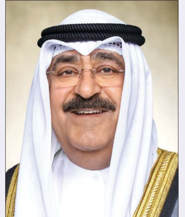
صاحب السمو الأمير الشيخ مشعل الأحمد