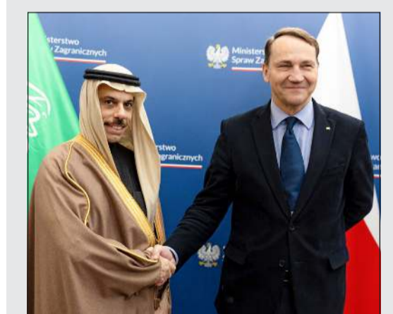
صاحب السمو الأمير فيصل بن فرحان وزير الخارجية السعودي خلال لقائه نظيره البولندي رادوسلاف سيكورسكي