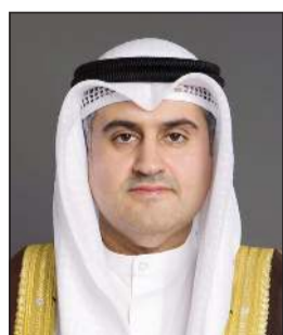
المستشار ناصر السميح

وشدد الوزير السميح على أن وزارة العدل ومختلف اللجان التي تم تشكيلها بذلت جهودا مضنية خلال الفترة الماضية في إعداد وتعديل العديد من القوانين، حيث أتمرت إنجاز 201 قانون ضمن الخطة الوطنية لتحديث المنظومة التشريعية، من أصل 250 قانونا مستهدفا حتى شهر ديسمبر من العام الحالي 2026 بنسبة إنجاز بلغت 80٪، وذلك بعد اعتمادها من مجلس الوزراء. وأوضح أن الخطة الوطنية لتحديث المنظومة التشريعية التي شملت إنجاز 201 قانون تمثل نسبة 20٪ من إجمالي 983 قانونا ساريا في الكويت.