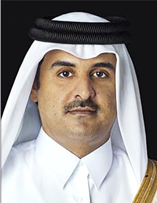
أمير دولة قطر صاحب السمو الشيخ تميم بن حمد آل ثاني