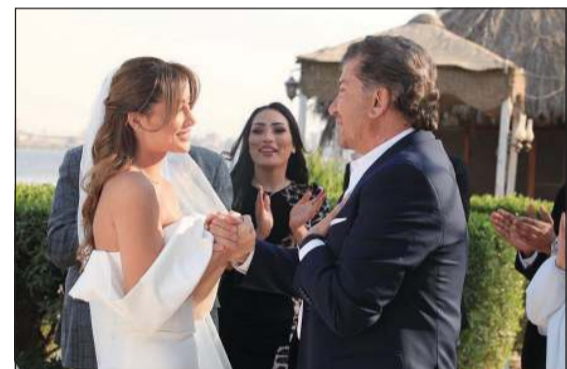
من كليب «كبرت البنوت»

بحسون، والأغنية من كلمات والحنان: الفنان جورج خزان، وتوزيع: باسم منير، وتحكي عن أب متعلق بابنته بصورة كبيرة لدرجة أنه يقف أمام