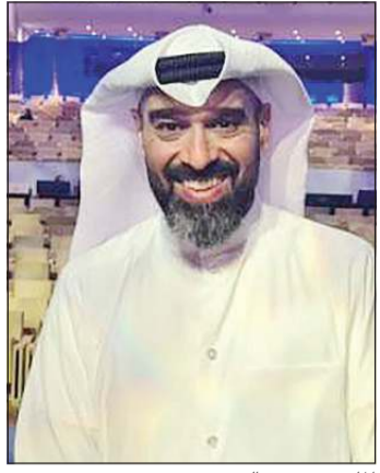
المايسترو دخال نوري

شريف الليثي وإخراج معزز التوني. كانت ياسمين عبدالعزيز قد أعلنت عن غضبها بعدما انتشرت على مواقع التواصل الاجتماعي صور لها أظهرتها