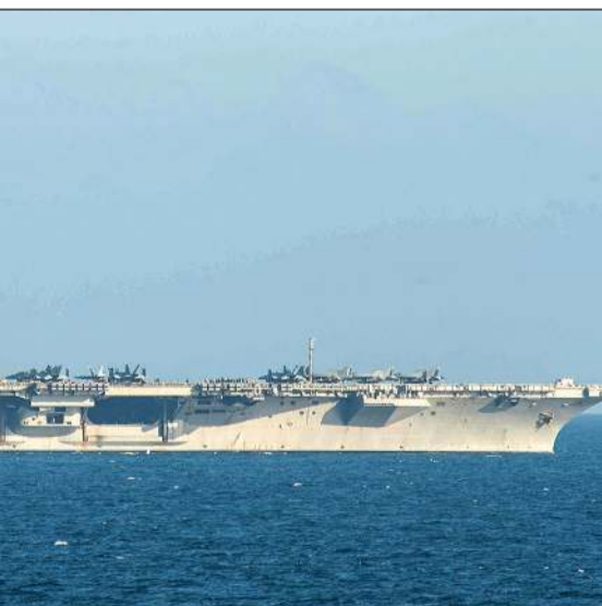
صورة أرشيفية لحاملة الطائرات الأميركية أبراهام لينكولن

وكان الرئيس الأميركي دونالد ترامب أعلن أن «أسطول ضخ» أميركي، بقيادة الجنرال نضطر لاستخدامه، وأعاد ترامب التأكيد على أن تهديده باستخدام القوة ضد طهران حال دون تنفيذ 837 حكم إعدام شنقا بحق متظاهرين، لكنه أكد أيضاً أنه منفتح على الحوار معها. والتعدت الاحتجاجات في إيران أواخر ديسمبر 2025 على خلفية تدهور قيمة العملة المحلية وتفاقم الأزمة الاقتصادية، وانطلقت من طهران قبل أن تمتد إلى مدن عدة، واستمرت أكثر من أسبوعين. ووفق وكالة أنباء نشطاء حقوق الإنسان (هرانا) أمس الأول، وصلت حصيلة ضحايا