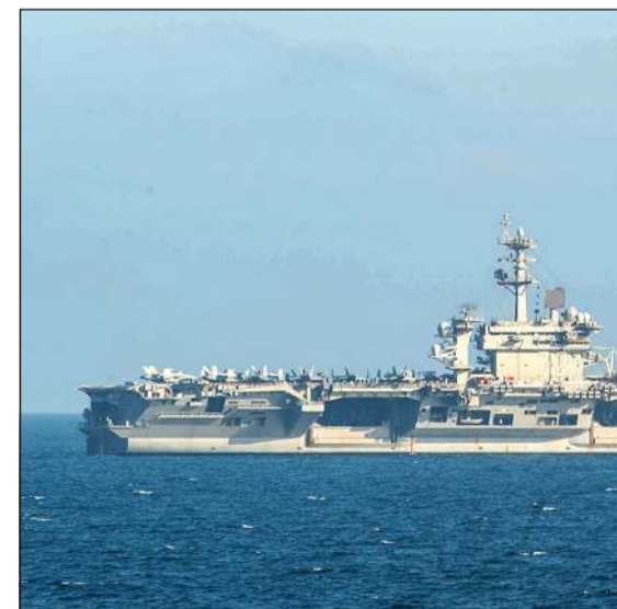
صورة أرشيفية لحاملة الطائرات الأميركية أبراهام لينكولن (أ.ف.ب)

في البيان إن العقوبات «تستهدف حلقة رئيسية في آلية التمويل التي تتيح لإيران قمع شعبيها». وتجمد العقوبات الأميركية جميع الأصول التي يمتلكها الأفراد والكيانات المستهدفة في الولايات المتحدة. كما تحظر على أي شركة أو مواطن أميركي التعامل معهم، تحت طائلة العقوبات. وقالت الوزارة في بيان إن السفن المستهدفة والتي تم تسجيل أربع منها في أرخبيل بالاو في المحيط الهادئ، ومالكها ونقلوا نفطاً ومنتجات بترول إيرانية بقيمة مئات الملايين من الدولارات. وقال الوزير سكوت بيستنت فرض عقوبات اقتصادية جديدة على «أسطول الظل» الذي ينقل النفط الإيراني، وذلك بهدف قطع الموارد المالية عن إيران. ووسعت وزارة الخزانة الأميركية قائمة سفن وكيانات تقول إنها مرتبطة بهذا الأسطول الذي يتبع طهران الالتفاف على العقوبات الأميركية لتصدير النفطها.