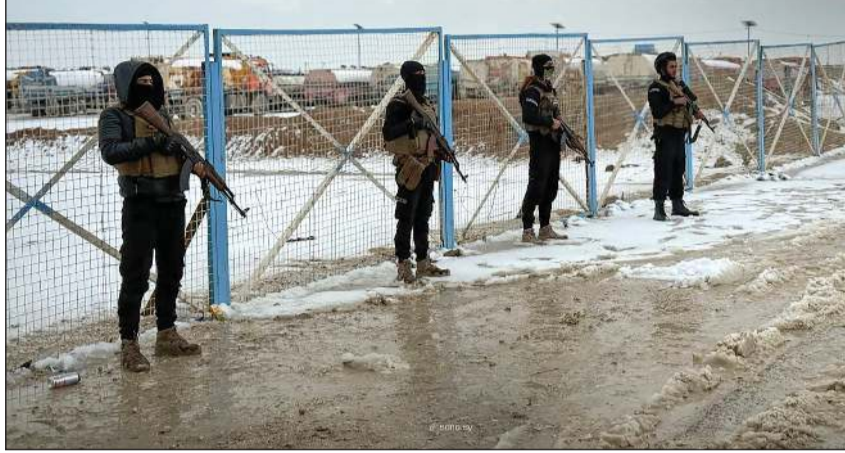
قوات الأمن السورية تطوق مخيم الهول في الحسكة

عواصم - وكالات: انتشرت القوات السورية في محيط مدينة عين العرب بريف حلب، تزامناً مع انتهاء المهلة التي منحتها الحكومة السورية إلى قوات سوريا الديمقراطية «قسد» التي يهيمن عليها الأكراد، حول مستقبل محافظة الحسكة، بموجب التفاهم المشترك الذي أعلنت عنه الرئاسة السورية الأسبوع الماضي.