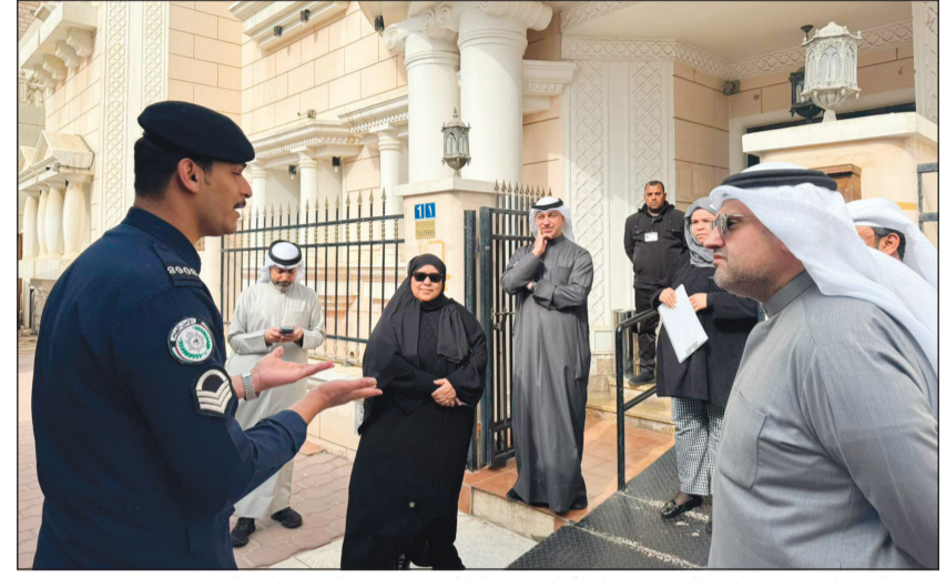
وزير العدل المستشار ناصر السميطة ووكيلة الوزارة بالتكليف عواطف السند خلال الزيارة

تجربة الأسر المستفيدة من مصلحة الطفل وراحتة النفسية تمثل المرتكز في مراكز الرؤية.