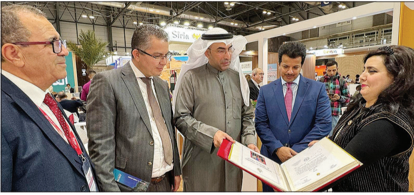
وكيل وزارة الإعلام د.ناصر محيسن يطلع على أبرز المبادرات والمشاريع السياحية العالمية

المستشار الرفاعي: نسبة إنجاز غير مسبقة نظراً لزيادة عدد الطعون وتناقص عدد وكلاء ومستشاري المحكمة