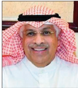
المستشار محمد أحمد الرفاعي

فيها كانت لأسباب مبررة خارجة عن سلطة المحكمة، مثل تداولها أمام إدارة الخبراء أو غيرها من الجهات الفنية المختصة. وأشار المستشار الرفاعي إلى أن النسبة المشار إليها هي نسبة غير مسبقة نظراً إلى زيادة عدد الطعون، وتناقص عدد وكلاء ومستشاري المحكمة لتزويد محكمة الاستئناف محكمة التمييز كل عام بعدد غير قليل من مستشاريها.