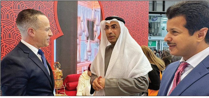
وكيل وزارة الإعلام د.ناصر محيسن خلال جولة في المعرض الدولي للسياحة (فيتور)

وتأتي الزيارة ضمن جهود وزارة الإعلام لتعزيز صورة دولة الكويت إعلامياً وسياحياً وترسيخ حضورها الفاعل في الفعاليات الدولية الكبرى بما ينسجم مع رؤية الدولة في الانفتاح وبناء الشراكات الاستراتيجية.