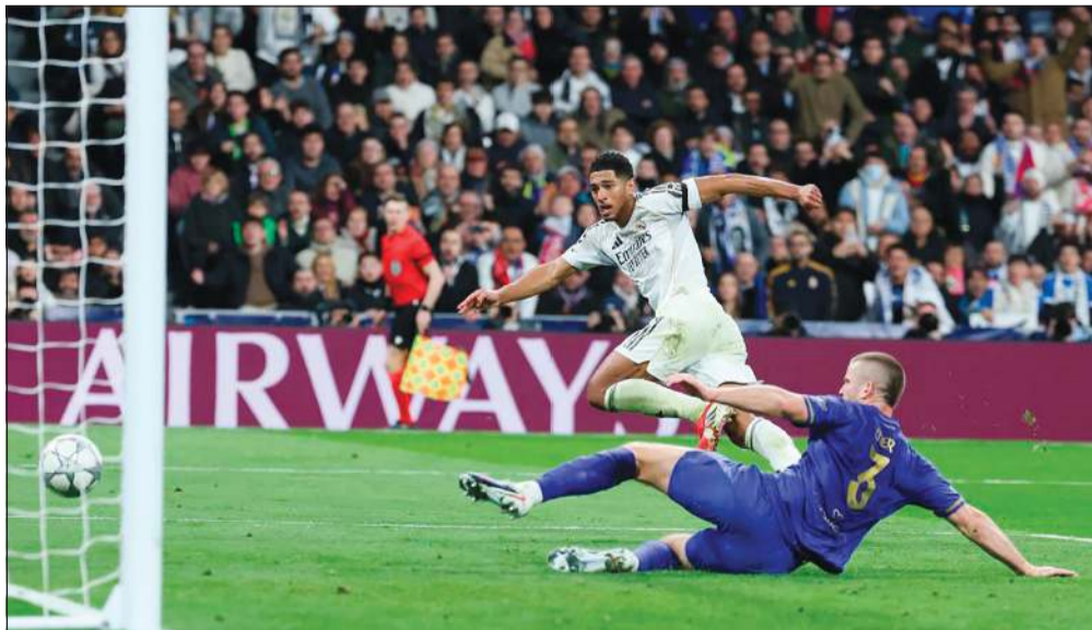
جورد بيلينغهام يسجل الهدف السادس لريال مدريد في شيك مانوكو