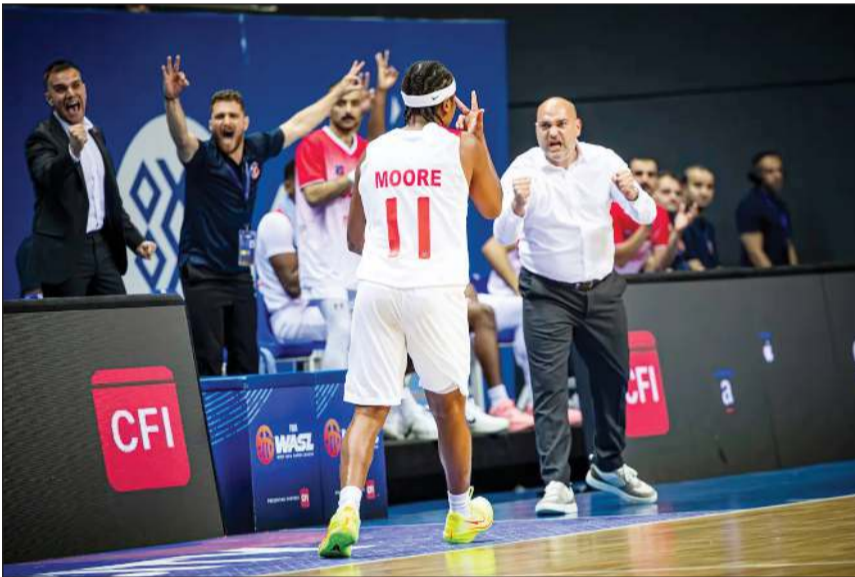
دوشان ستوجكوف قاد الكويت لفوز كبير على الشارقة الإماراتي

ما تعادل الفريقان بالفوز لكل منهما تقام مواجهة فاصلة بالكويت 17 فبراير المقبل، على أن يتأهل الفائز لملاقاة الاتحاد السعودي في نصف النهائي، وعلى الجهة الأخرى، سيلعب العربي القطري 3 مواجهات مع نظيره شباب الأهلي الإماراتي بنظام «البلاي أوف»، 2 و 9 و 18 فبراير المقبل، على أن يلتقي الفائز مع العلاء السعودي في «المرجع الذهبي».