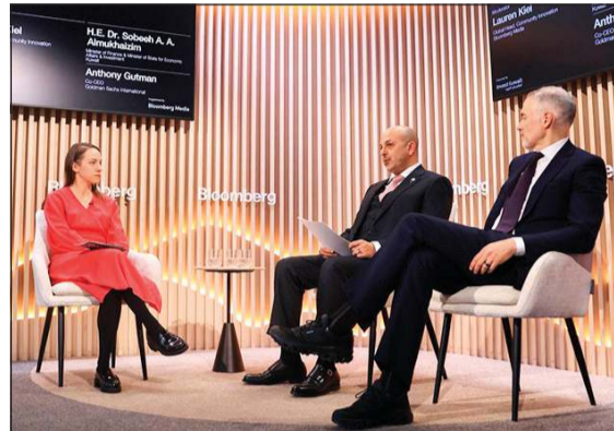
وزير الكهرباء والماء والطاقة المتجددة ووزير المالية وزير الدولة للشؤون الاقتصادية والاستثمار بالدولة الكويتية في جلسة حوارية منظمة من قبل «Bloomberg» على هامش منتدى دافوس

طويلة الأجل والممتدة لأجيال في ظل أسواق عالمية متقلبة وحالة عدم اليقين التي تسيطر على الأسواق العالمية، مدفوعاً بشبكة علاقات متميزة تجمع دولة الكويت مع مختلف الدول والشركاء. وتأتي هذه الجلسة ضمن مشاركة وزير الكهرباء والماء والطاقة المتجددة ووزير المالية وزير الدولة للشؤون الاقتصادية والاستثمار بالدولة الكويتية في جلسة حوارية منظمة من قبل «Bloomberg» على هامش منتدى دافوس.