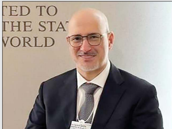
وزير التجارة والصناعة خليفة العجيل ضمن مشاركته في المنتدى الاقتصادي العالمي «دافوس»

خليفة العجيل: نحرص على ترسيخ موقع البلاد كشريك دولي موثوق بالتجارة والاستثمار