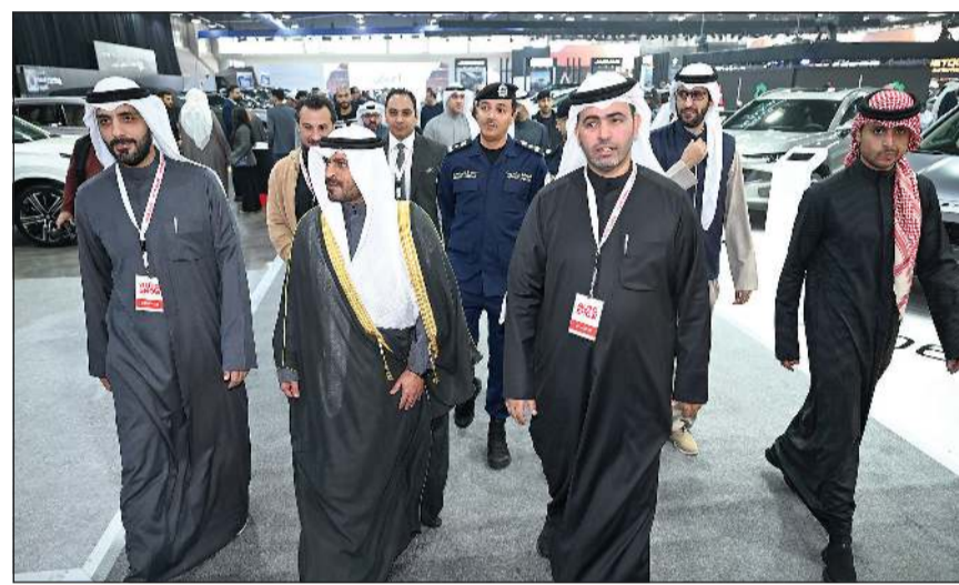
محافظ مبارك الكبير ومحافظ حولي بالتكليف الشيخ صباح بدر صباح السالم الصباح خلال جولة في المعرض

وأكد منظمو المعرض، في إطار حرصهم على تقديم تجربة شراء متكاملة، توفير باقة واسعة من خيارات التمويل، من خلال مشاركة مجموعة متنوعة من البنوك وشركات التمويل المتخصصة، إلى جانب حلول التأمين المختلفة، بما يمنح العملاء مرونة أكبر في اتخاذ قرار الشراء. كما راعي المعرض احتياجات شريحة كبيرة من الزوار الراغبين في إضافة تجهيزات وحلول عملية لسياراتهم، مثل أنظمة الحماية، والإكسسوارات، والتعديلات، عبر مشاركة شركات متخصصة في هذا المجال، ما يعزز من القيمة المضافة للمعرض كوجهة شاملة لعشاق السيارات في الكويت.