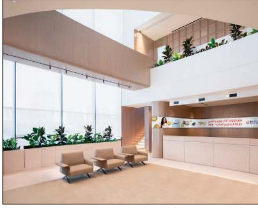
بنك الخليج يوفر تجربة مميزة للعملاء في فروع