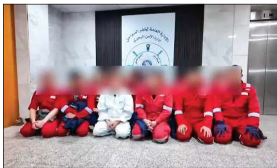
المضبوطون على متن القطعة البحرية في الإدارة العامة لخفر السواحل

إحالتهم إلى جهة الاختصاص لاتخاذ كافة الإجراءات القانونية اللازمة بحقهم. وأكدت وزارة الداخلية استمرارها في تشديد الرقابة الأمنية البحرية، وعدم