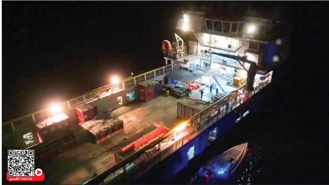
القطعة البحرية المستخدمة في تهريب الديزل المدعوم

الكويت الأول للأورام النسائية والمسالك البولية يقام للمرة الأولى». وأضافت: «اخترنا هذه الأورام لأنها في تطور مستمر من ناحية العلاجات المتقدمة لكن من المهم أننا نستطيع التحكم في عوامل الخطر المرتبطة بها. العلاجات تتطور بسرعة، ونسب الشفاء في ارتفاع، ومع تخصص المبرك أصبح المرضى يعيشون فترات أطول. لدينا محاضرون من الولايات المتحدة وبريطانيا وإسبانيا وإيطاليا والنرويج، بالإضافة إلى نحو 39 محاضراً من الخليج والدول العربية وبالطبع من الكويت». وحول نسبة التحديات في الكويت، أوضحت أن الزيادة في حالات الأورام تتماشى مع الأرقام العالمية لأن عدد السكان في ازدياد، وهذا ليس أمراً مقلقاً. لذلك نرى الأورام تمتد لفترات أطول أيضاً. على سبيل المثال،