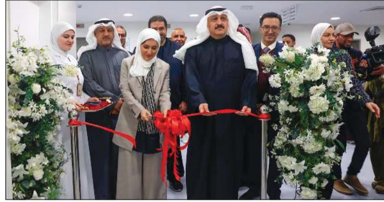
وزير الصحة د. أحمد العوضي خلال افتتاح جناح إضافي للجراحة في المستشفى الأميري

في إطار التوسع المستمر في البنية التحتية الصحية، وحرص وزارة الصحة على رفع كفاءة الخدمات الجراحية وتلبية الطلب المتزايد على الرعاية المتخصصة، تم افتتاح جناح إضافي للجراحة في المستشفى الأميري، بحضور وزير الصحة د. أحمد العوضي، في خطوة استراتيجية تهدف إلى تحسين تجربة المريض، وتسريع مسارات العلاج، ودعم جاهزية المنظومة الصحية. وبهذه المناسبة، أكد وزير الصحة د. أحمد العوضي أن هذه الخطوة تأتي استجابة للحاجة إلى زيادة الطاقة السريرية وتوفير بيئة علاجية متكاملة تواكب المعايير الحديثة للرعاية الصحية، بما يعكس مبادئ جودة الخدمات المقدمة وسلامة المرضى وكفاءة الأداء الطبي والتريفي، كما تساهم في تخفيف الضغط على الأجنحة القائمة وتعزيز القدرة التشغيلية للمستشفى في استقبال الحالات الجراحية بمختلف درجاتها.