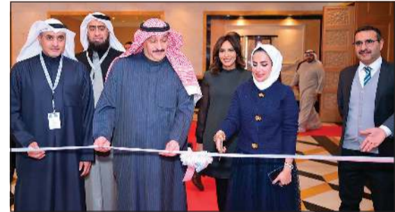
وزير الصحة د. أحمد العوضي خلال افتتاحه مؤتمر الكويت الأول للأورام النسائية والمسالك البولية

أشاد وزير الصحة د. أحمد العوضي بما شاهدته من تقنيات حديثة وأدوية غيرت ملامح الخطة العلاجية وأسهمت في رفع نسب الشفاء. وقال العوضي خلال افتتاحه مؤتمر الكويت الأول للأورام النسائية والمسالك البولية «نحن نسعى دائماً لتقديم خدمات صحية ذات جودة عالية وأمنة لمرضى السرطان»، مضيفاً أن هذا الحدث العلمي المتخصص يجمع نخبة من الخبراء والاستشاريين من داخل الكويت وخارجها، وأضاف أن هذا المؤتمر يناقش أحدث المستجدات في علاج الأورام النسائية والمسالك البولية، ويتيح منصة لتبادل الخبرات وتطوير منظومة الرعاية الصحية بما يضمن أفضل الممارسات لصالح المرضى. من جانبها، قالت استشارية طب الأورام ورئيسة اللجنة المنظمة للمؤتمر د. مريم عبدالمحسن العيني «المؤتمر