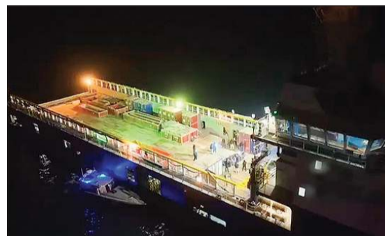
القطعة البحرية تم رصدها من قبل القوارب المسيّرة التابعة لخفر السواحل