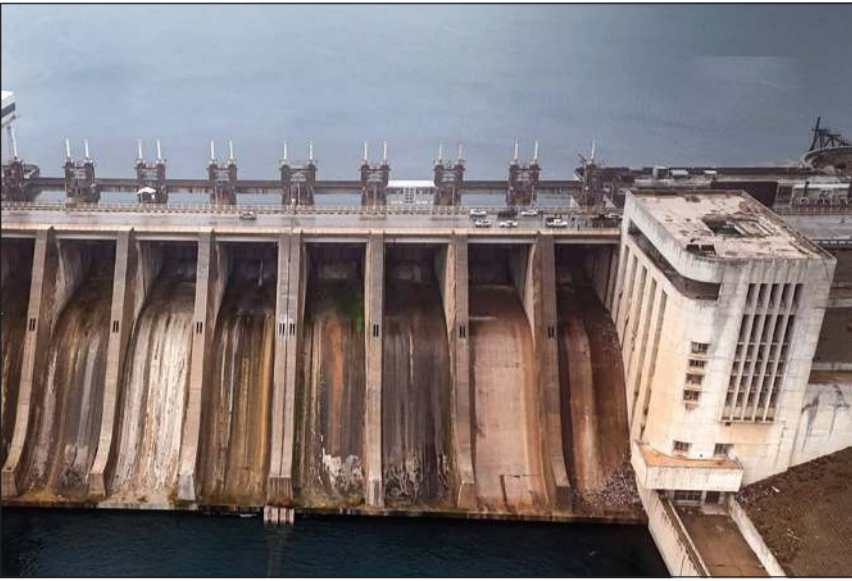
صورة جوية نشرتها وكالة «سانا» لسد الفرات بعد السيطرة عليه

وأكد المحافظ في تصريحات لقناة «الإخبارية»، أن المحافظة وضعت خطة طارئة تلي الاحتياجات الإنسانية الناتجة عن الاشتباكات مع تنظيم قسد. وحقل العمر هو أكبر حقول النفط في سورية، وكان تحت سيطرة «قسد» منذ طرد تنظيم داعش منها عام 2017. وقام الحقل لسنوات أبرز قاعدة للحذاف الدولي بقيادة واشنطن الذي قدم دعماً مباشراً للأكراد حتى دحر التنظيم من آخر نقاط سيطرته عام 2019.