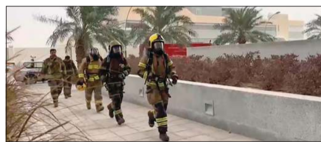
رجال الإطفاء خلال التمرين العملي

نفذت قوة الإطفاء العام تمريناً عملياً صباحاً أمس في مبنى مستشفى الجهراء. وأوضحت «الإطفاء» أن مركز إطفاء الجهراء قام بتنفيذ التمرين وتم خلاله إخمد حريق افتراضي وإخراج المحسورين. ويأتي هذا التمرين ضمن جهود قوة الإطفاء العام لتعزيز التعاون مع مؤسسات القطاع الخاص والتأكد من جاهزية العاملين للتعامل مع حالات الطوارئ وفق أعلى معايير السلامة المهنية.