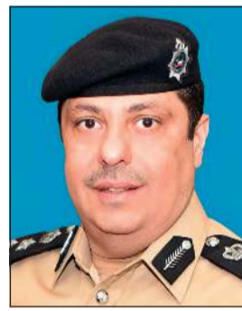
رئيس الموارد البشرية وتقنية المعلومات بوزارة الداخلية العميد أنور اليتلي

وزارة الداخلية: تقدم وزارة الداخلية بالشكر والتقدير إلى بنك برقان على جهودهم