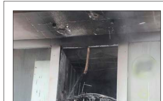
جانب من الحريق

سيطرت فرق إطفاء مركزي المنقف والبيرق صباحاً أمس على حريق محل خياطة في مجمع بمنطقة العقيلة، حيث باشرت الفرق مكافحة الحريق والسيطرة عليه، ولم يسفر الحادث عن أي إصابات تذكر.