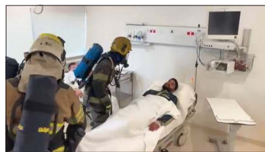
جانب آخر من التمرين

نفذت قوة الإطفاء العام تمريناً عملياً صباحاً أمس في مبنى مستشفى الجهراء. وأوضحت «الإطفاء» أن مركز إطفاء الجهراء قام بتنفيذ التمرين وتم خلاله إخمد حريق افتراضي وإخراج المحسورين. ويأتي هذا التمرين ضمن جهود قوة الإطفاء العام لتعزيز التعاون مع مؤسسات القطاع الخاص والتأكد من جاهزية العاملين للتعامل مع حالات الطوارئ وفق أعلى معايير السلامة المهنية.