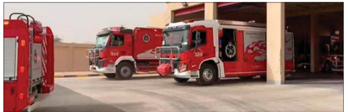
سيارات الإطفاء خلال التمرين