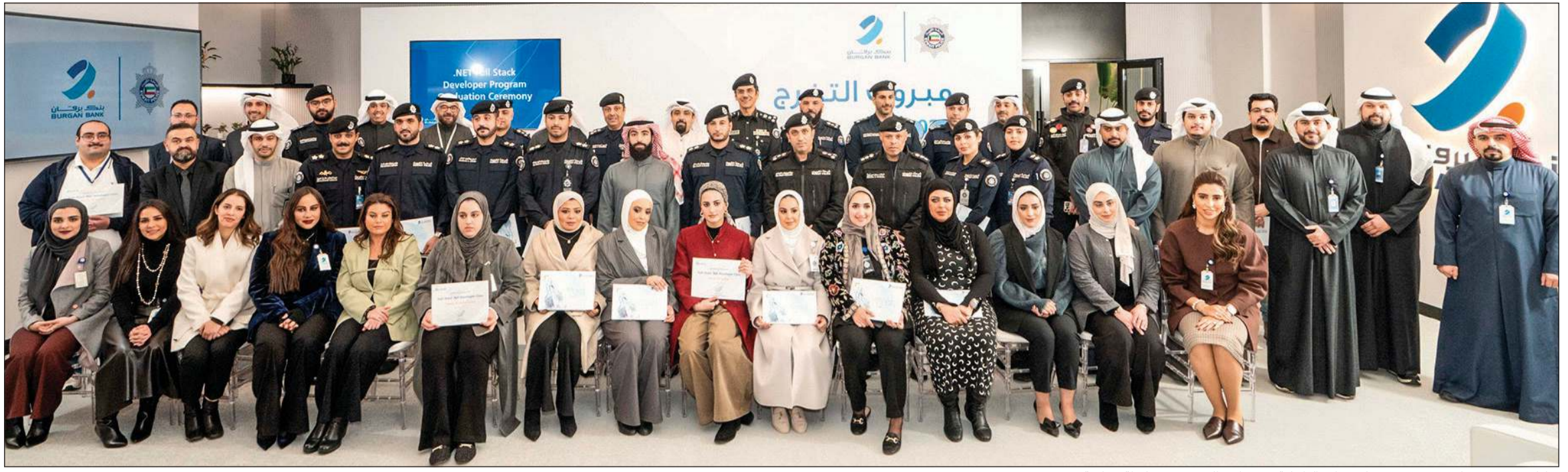
قيادات من بنك برقان وعدد من مسؤولي وزارة الداخلية يتوسطون الخريجين في لقطة جماعية