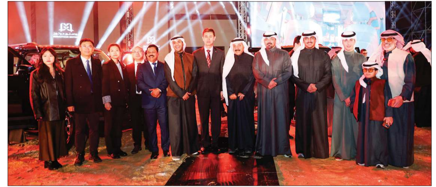
نجم بودستور وإداريو «بودستور موتورز» ووفد من السفارة الصينية بالكويت في صورة جماعية بعد الكشف عن جيتور G700