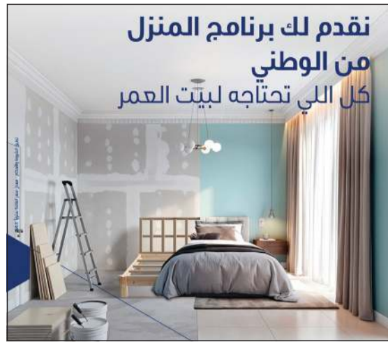
نقدم لك برنامج المنزل من الوطني كل اللي تحتاجه لبيت العمر

«الوطني» برنامج المنزل لتكون تجربة متكاملة تبدأ من الفكرة وتنتهي بتحقيق الحلم، مدعومة بحلول تمويلية مرنة وشركات إستراتيجية مع نخبة من العلامات التجارية الرائدة في السوق المحلي. كما يحرص البنك على أن يكون جزءاً من رحلة عملائه نحو تحقيق أحلامهم السكنية، سواء عبر القروض السكنية أو برنامج المنزل، تأكيداً لالتزامه الراسخ بمواصلة الابتكار وتقديم الأفضل دائماً. وفي هذا الإطار، لا يكفي «الوطني» بتقديم مجرد تمويل، بل يوفر لعملائه منظومة متكاملة من الخدمات التي تجعل رحلتهم نحو بيت العمر أكثر سلاسة وراحة، الأمر الذي يعكس التزامه العميق بتعزيز جودة حياة عملائه، ويؤكد ريادته في تقديم حلول مصرفية مبتكرة ترتكز على الشراكة والثقة والقيمة المضافة.