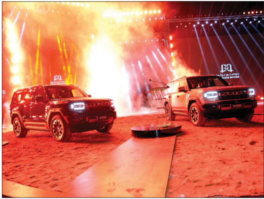
لحظة الكشف عن جيتور G700 الجديدة كلياً