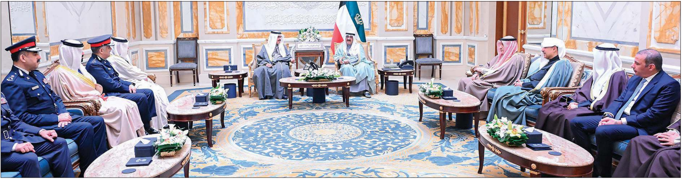
صاحب السمو الأمير الشيخ مشعل الأحمد مستقبلاً وزير الداخلية بمملكة البحرين الفريق أول ركن الشيخ راشد بن عبدالله بن أحمد آل خليفة والوفد المرافق بحضور النائب الأول لرئيس مجلس الوزراء ووزير الداخلية الشيخ فهد اليوسف ووزير شؤون الديوان الأميري الشيخ حمد جابر العلي ومدير مكتب صاحب السمو الأمير الفريق متقاعد جمال الذياب ووكيل الشؤون الخارجية بالديوان الأميري مازن العيسى والسفير البحريني لدى البلاد صلاح الملكي