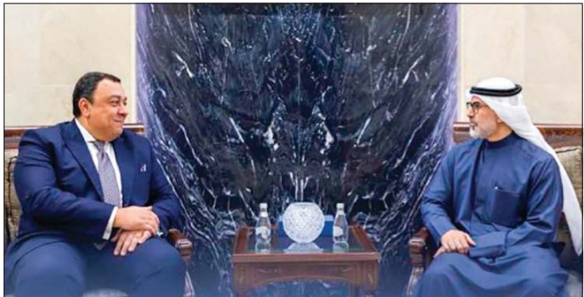
نائب وزير الخارجية السفير الشيخ جراح جابر الأحمد مستقبلاً مساعد وزير الخارجية للشؤون العربية في وزارة الخارجية والهجرة وشؤون المصريين بالخارج السفير إيهاب فهمي

زيارته والوفد المرافق له للبلاد. وذكرت «الخارجية» في بيان لها، أنه تم خلال اللقاء بحث سبل توطيد العلاقات الثنائية بين البلدين الشقيقين في كافة المجالات، بالإضافة إلى أبرز المستجدات على الساحتين الإقليمية والدولية.