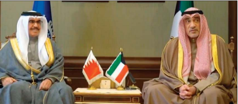
النائب الأول لرئيس مجلس الوزراء ووزير الداخلية الشيخ فهد اليوسف خلال لقائه وزير الداخلية في مملكة البحرين الفريق أول ركن الشيخ راشد بن عبدالله آل خليفة

بين الجانبين، إضافة إلى الاطلاع على التجربة البحرينية في مجال العقوبات البديلة والسجون المفتوحة، وما حققت من نتائج إيجابية في إطار تطوير منظومة العدالة الجنائية، وتعزيز مفاهيم الإصلاح وإعادة التأهيل، بما يسهم في دعم الأمن والاستقرار المجتمعي.