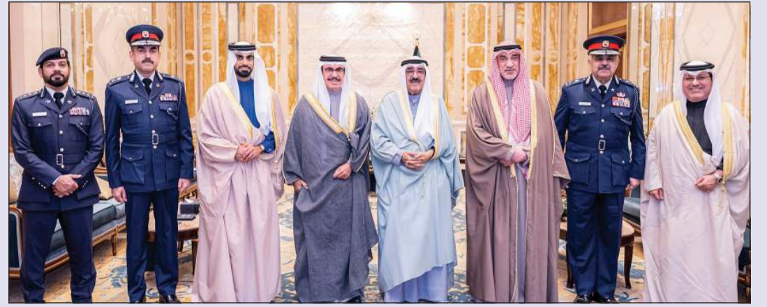
صاحب السمو الأمير الشيخ مشعل الأحمد خلال استقباله وزير الداخلية بمملكة البحرين الفريق أول ركن الشيخ راشد بن عبدالله بن أحمد آل خليفة والوفد المرافق بحضور النائب الأول لرئيس مجلس الوزراء ووزير الداخلية الشيخ فهد اليوسف والسفير البحريني صلاح الملكي

إِنَّا لِلَّهِ وَإِنَّا إِلَيْهِ رَاجِعُونَ