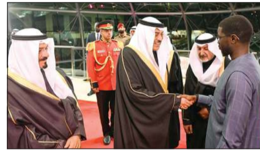
سمو ولي العهد الشيخ صباح خالد مستقبلاً الرئيس بشيرو جوماي فاي رئيس السنغال بحضور رئيس الوزراء سمو الشيخ أحمد العبدالله