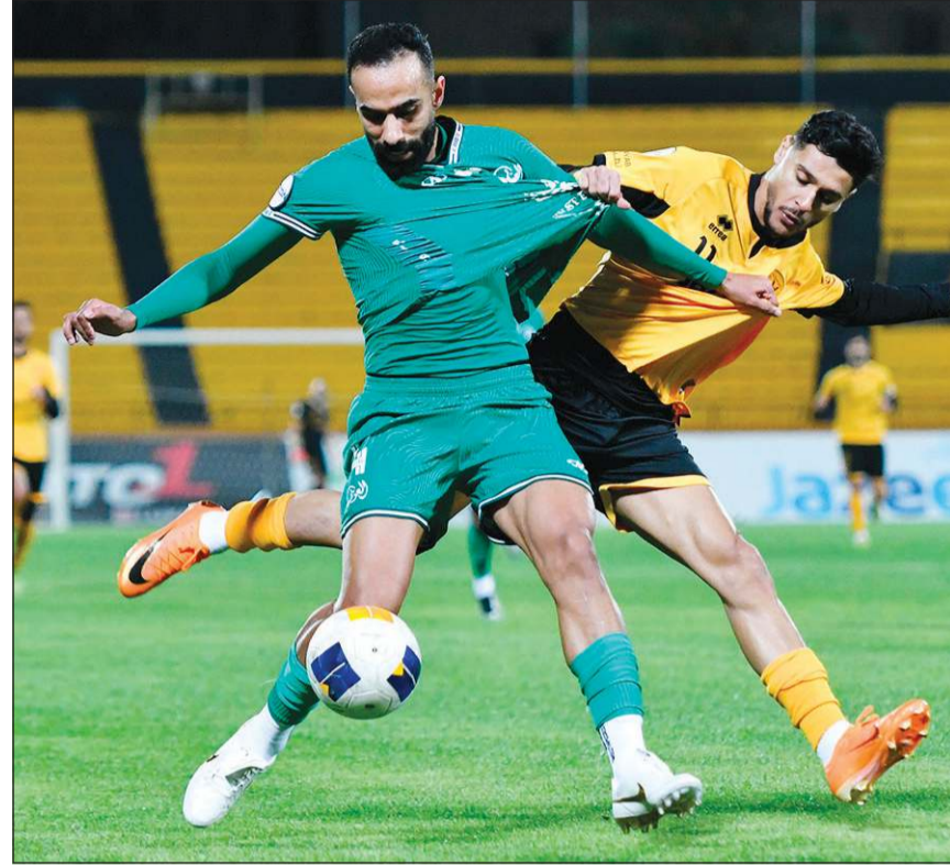
مواجهة «شد وجذب» ستجمع القادسية والعربي لرد اعتبار «الأصفر» أو تأكيد تفوق «الأخضر»

وبدخل «الأصفر» المباراة بصياغات مختلفة نظرا لقوة خصمه، لذلك يجب على مدربه معلول