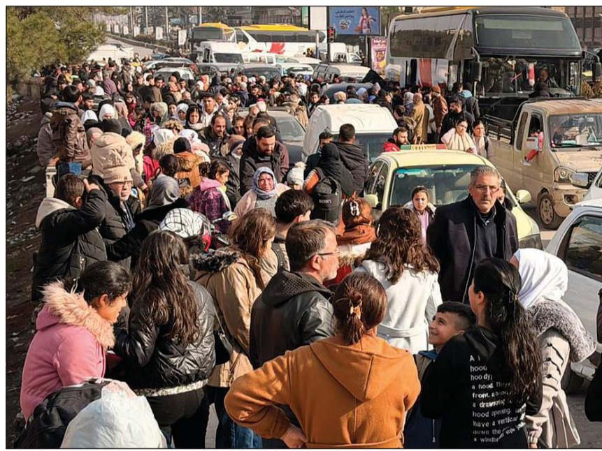
صور نشرتها «سانا» لخروج الأهالي من حي الشيخ مقصود بحلب عبر الممر الإنساني في شارع الزهور باتجاه حي السريان

وكالات: شهدت مدينة حلب تصعيداً ميدانياً أمس، وتجددت الاشتباكات بين قوات سوريا الديمقراطية (قسد)، التي يهيمن عليها الأكراد، والقوات الحكومية. لليوم الثاني على التوالي، حيث أعلن الجيش العربي السوري حيي الشيخ مقصود والأشرفية اللذين تسطر عليهما «قسد» منطقة عسكرية، ودعا المواطنين إلى الابتعاد عن مواقع «قسد»، وأعلن فتح ممرين إنسانيين لخروج المدنيين منها قبل فرض حظر تجوال فيها اعتباراً من الساعة الثالثة من بعد ظهر أمس. ونقلت قناة «الجزيرة» عن مصدر حكومي بدء «عملية عسكرية محدودة في حلب رداً على هجمات (قسد) المتواصلة». وقال المصدر إن «الجيش السوري سينفذ عملياته وفقاً للقانون الدولي مع إجلاء المدنيين والتهديدات المجموعات المسلحة»، واندلعت اشتباكات عنيفة استخدمت فيها الأسلحة المتوسطة على محاور القتال في طريق الحيين بعد أن بدأت في طريق الكاستيلو ودوار الليرمون، وشوهدت أعمدة الدخان وسمعت أصوات قذائف في عدة مناطق. وشهد حيا الأشرفية والشيخ مقصود اللذان