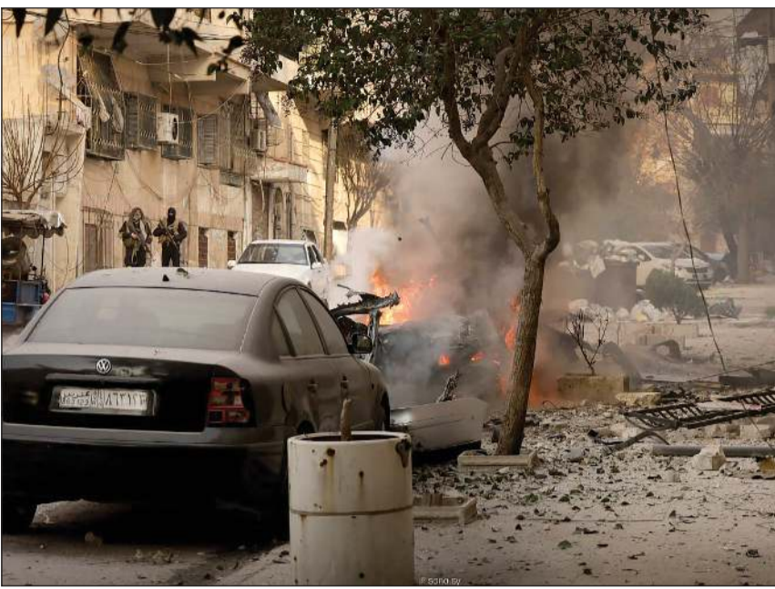
آثار الدمار الذي خلقه قصف «قسد» في محيط أحياء الشيخ مقصود والأشرفية