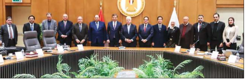
جانج من اجتماع مناقشة الخطوات التنفيذية الخاصة بإنشاء جامعة الغذاء

مجلس الوزراء: بدء إجراءات إنشاء جامعة الغذاء بالتعاون مع وزارتي التعليم العالي والزراعة