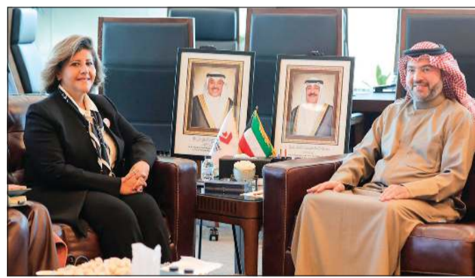
رئيس الهيئة العامة للطيران المدني الشيخ حمود المبارك مستقبلاً مساعد وزير الخارجية لشؤون حقوق الإنسان السفيرة الشيخة جواهر إبراهيم الديعج

كونا: بحث رئيس الهيئة العامة للطيران المدني الشيخ حمود المبارك مع مساعد وزير الخارجية لشؤون حقوق الإنسان السفيرة الشيخة جواهر إبراهيم الديعج سبل تعزيز التعاون المشترك. وقالت «الطيران المدني» في بيان صحافي إن الشيخة جواهر الديعج أطلعت خلال زيارتها للهيئة على الخدمات والمبادرات الدولية. وأسادت الشيخة جواهر وفق البيان بالتسهيلات المتوافرة لخدمة فئة ذوي الإعاقة والجهود المبذولة لتعزيز الشمولية وتحقيق معايير حقوق الإنسان في مطار الكويت الدولي.