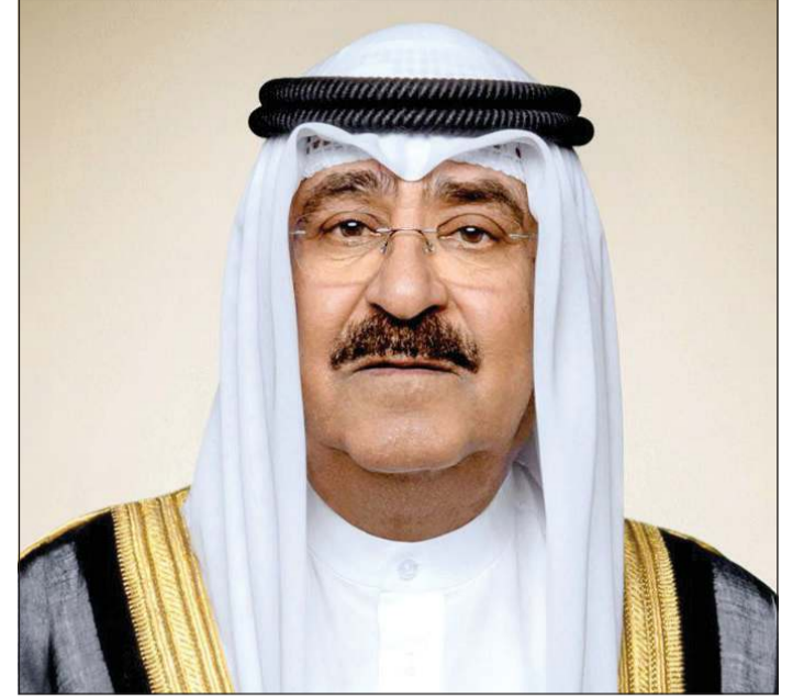
صاحب السمو الأمير الشيخ مشعل الأحمد

كونا: بعث صاحب السمو الأمير الشيخ مشعل الأحمد ببرقية تعزية إلى أخيه الملك عبدالله الثاني ابن الحسين ملك المملكة الأردنية الهاشمية الشقيقة، عبر فيها سموه، حفظه الله، عن خالص تعازيه وصادق مواساته بوفاة دولة المهندس علي أبو الراغب رئيس الوزراء الأسبق في المملكة الأردنية الهاشمية الشقيقة، سانلا سموه المولى تعالى أن يتغمده بواسع رحمته ويسكنه فسيح جناته وأن يلهم أسرته وذويه جميل الصبر وحسن العزاء.