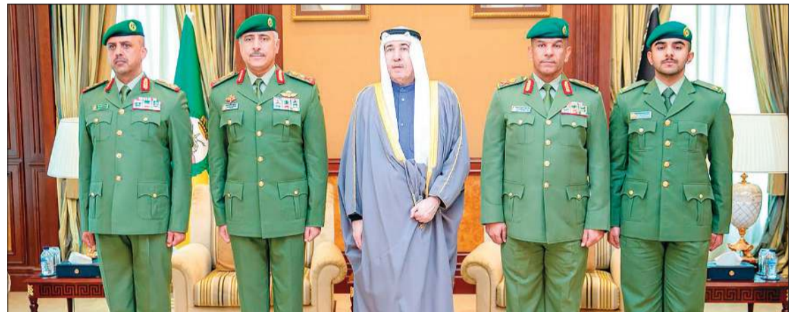
رئيس الحرس الوطني الشيخ مبارك الحمود ووكيل الحرس الوطني الفريق الركن حمد البرجس والمعاون للشؤون المالية وإدارة الموارد اللواء رياض محمد طواري وقائد الشؤون العسكرية والأمنية العميد الركن عبدالله صالح عبدالله والملازم عبدالله محمد سليمان

شاهد أداء ضابط القسم القانوني إيداناً بانضمامه إلى شرف الخدمة العسكرية، بحضور وكيل الحرس الوطني الفريق الركن حمد البرجس، وأدي الملازم عبدالله محمد سليمان خريج أكاديمية ساندهيرست العسكرية الملكية في المملكة المتحدة الصديقية القسم القانوني إيداناً بانضمامه إلى شرف الخدمة العسكرية في الحرس الوطني. وهنأ رئيس الحرس الوطني الشيخ مبارك الحمود ووكيل الحرس الوطني الفريق الركن حمد البرجس والمعاون للشؤون المالية وإدارة الموارد اللواء رياض محمد طواري وقائد الشؤون العسكرية والأمنية العميد الركن عبدالله صالح عبدالله والملازم عبدالله محمد سليمان بالقسم القانوني.