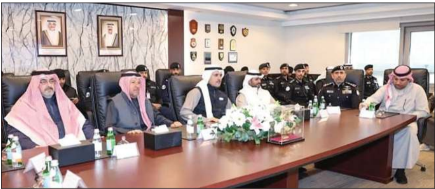
مدير عام الإدارة العامة لخفر السواحل العميد ركن بحري الشيخ مبارك علي اليوسف ومحافظ الفروانية الشيخ عبد الله السالم خلال الجولة

كونا: قام محافظو محافظات البلاد بزيارة ميدانية إلى قاعدة «صباح الأحمد» لخفر السواحل، وذلك للتعرف على الخدمات التي تقدمها الإدارة العامة لخفر السواحل للجهات الحكومية والأهلية إضافة إلى الخدمات المجتمعية، ودورها في دعم مختلف الجهات وتعزيز منظومة الأمن البحري. وذكرت وزارة الداخلية في بيان صحافي أنه كان في استقبال محافظ الفروانية الشيخ عبد الله السالم ومحافظ العاصمة الشيخ عبد الله السالم ومحافظ الأحدي الشيخ حمود الجابر ومحافظ مبارك الكبير ومحافظ حويي بالتكليف الشيخ صباح بدر السالم خلال الجولة