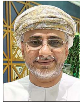
نائب سفير عمان شهاب الرواس

ونكر أن هناك خط طيران مباشرة من مطار مسقط إلى جزيرة «مصيرة» بمحافظة جنوب الشرقية عبر شركة «السلام» للطيران للتسهيل على الراغبين في الذهاب إلى الجزيرة من محبي الصيد والغوص فيها، وهناك من يذهبون إليها عن طريق «البواخر»، لافتاً إلى أن «مصيرة» تشهد حالياً عدداً من المشاريع السياحية لخدمة أهالي المنطقة والزوار من مختلف الدول.