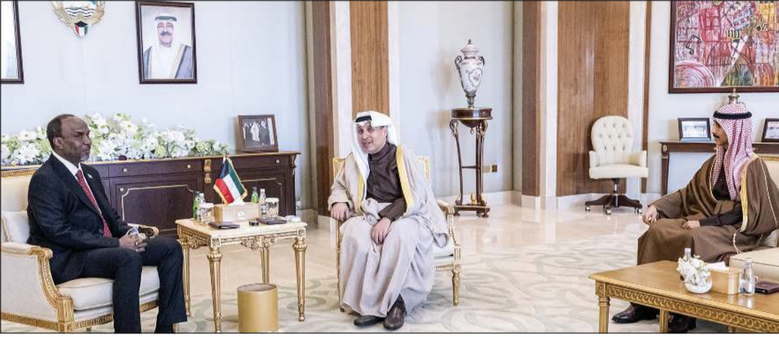
وزير شؤون الديوان الأميري الشيخ حمد جابر العلي ورئيس ديوان سمو ولي العهد الشيخ ثامر الجابر خلال استقبالهما سفير جيبوتي لدى الكويت عيسى خيرى روبله

المتميزة التي تجمع البلدين والشعبين الشقيقين وبحث السبل الكفيلة بتعزيز أطر التعاون القائم وتطويره في مختلف الميادين وتوسيع نطاق الشراكة الثنائية بما يخدم المنفعة المتبادلة ويعكس متانة الروابط بينهما، كما تمت مناقشة آخر التطورات في الساحتين الإقليمية والدولية وبحث عدد من الموضوعات ذات الاهتمام المشترك.