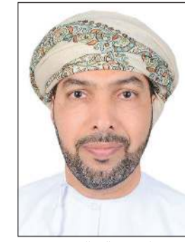
سفير عمان د.صالح الخروصي

الزيارة ومقترحاتهم لتطوير الجانب السياحي في السلطنة. وقال الخروصي إن سلطنة عمان غنية بالمواقع والبيئات السياحية المتنوعة كالصحراوية والجبلية والبحرية، وتتمتع بشواطئ جميلة على امتداد أكثر من 3500 كم، لافتاً إلى أن هناك شغفا وعشقا كبيرا من المواطنين الكويتيين بممارسة «الحدائق» في بلادها، مشيراً إلى الزيادة الكبيرة في