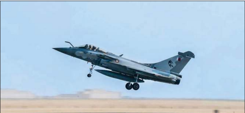
إحدى الطائرات المشاركة في التمرين

انطلقت فعاليات تمرين «درع الخليج 2026» في المملكة العربية السعودية الشقيقة، بمشاركة الجيش الكويتي والقوات المسلحة لدول مجلس التعاون لدول الخليج العربية، وقالت رئاسة الأركان إن التمرين يهدف إلى رفع مستوى الجاهزية القتالية، وتعزيز العمل العسكري المشترك وتحقيق التكامل في بيئة العمليات المشتركة، وفق أفضل الممارسات بما يساهم في توحيد المفاهيم التشغيلية ورفع كفاءة التنسيق بين القوات المشاركة، موضحة أن التمرين يشتمل على حزمة متكاملة من الإجراءات والاختبارات والفرصات العملياتية المصممة لقياس الجاهزية القتالية وفاعلية الاستجابة لمختلف التهديدات، بما يحقق التكامل في منظومة الردع المرن. ويشترك الجيش الكويتي ممثلا بالقوة الجوية وسلاح الدفاع الجوي في هذا التمرين تأكيدا للالتزام الكويت بدعم منظومة العمل العسكري الخليجي المشترك، بما يساهم في الحفاظ على أمن وسلامة واستقرار دول المجلس.