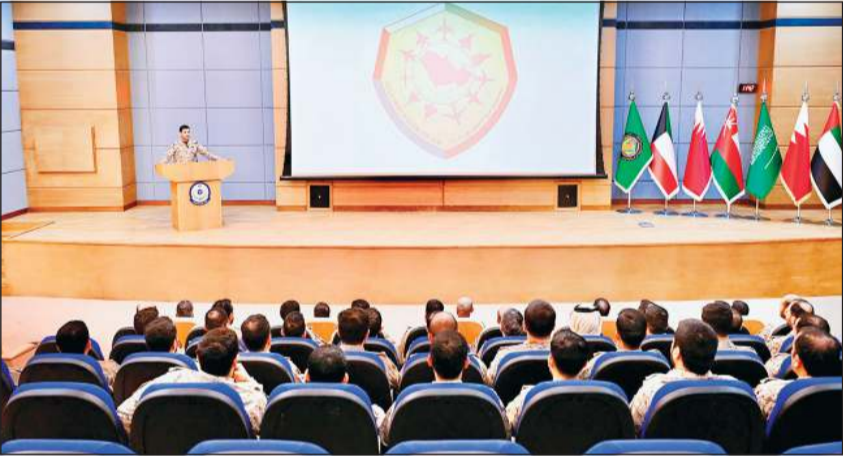
الإطلاع على فعاليات التمرين

انطلقت فعاليات تمرين «درع الخليج 2026» في المملكة العربية السعودية الشقيقة، بمشاركة الجيش الكويتي والقوات المسلحة لدول مجلس التعاون لدول الخليج العربية، وقالت رئاسة الأركان إن التمرين يهدف إلى رفع مستوى الجاهزية القتالية، وتعزيز العمل العسكري المشترك وتحقيق التكامل في بيئة العمليات المشتركة، وفق أفضل الممارسات بما يساهم في توحيد المفاهيم التشغيلية ورفع كفاءة التنسيق بين القوات المشاركة، موضحة أن التمرين يشتمل على حزمة متكاملة من الإجراءات والاختبارات والفرصات العملياتية المصممة لقياس الجاهزية القتالية وفاعلية الاستجابة لمختلف التهديدات، بما يحقق التكامل في منظومة الردع المرن. ويشترك الجيش الكويتي ممثلا بالقوة الجوية وسلاح الدفاع الجوي في هذا التمرين تأكيدا للالتزام الكويت بدعم منظومة العمل العسكري الخليجي المشترك، بما يساهم في الحفاظ على أمن وسلامة واستقرار دول المجلس.