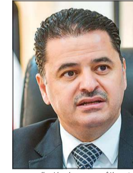
السفير الأردني سنان المجالي

والتقديم الإلكتروني قد تغلق قبل هذه المواعيد في حال اكتمال المقاعد المتاحة في بعض البرامج أو التخصصات. وأضاف أن الطالب يقوم بتقديم طلب الالتحاق إلكترونياً من خلال النظام الموحد، مع تحميل الوثائق المطلوبة واقتحام الطالب ودفع رسم التقديم البالغ 35 ديناراً أردنياً (ما يعادل 50 دولاراً) عبر خدمة الدفع الإلكتروني المعتمدة. وشدد السفير الأردني على أن قبول الطلبة الوافدين في الجامعات والكليات الرسمية يتم حصراً عبر نظام القبول الموحد الإلكتروني، مؤكداً في الوقت ذاته أن الجامعات والكليات الخاصة تتيح للطلبة التقديم إما عبر النظام ذاته أو بالتواصل المباشر مع الجامعة المعنية، دون الحاجة إلى أي وسطاء أو دفع أي رسوم إضافية لأي جهة كانت.