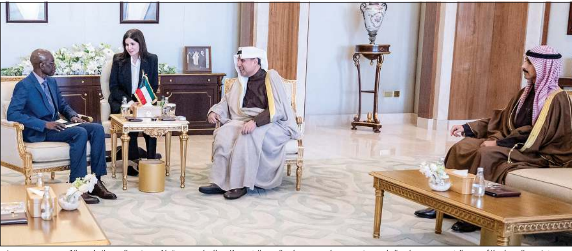
وزير شؤون الديوان الأميري الشيخ حمد جابر العلي ورئيس ديوان سمو ولي العهد الشيخ ثامر الجابر يستقبلان سفير السنغال لدى الكويت حسن سوغو