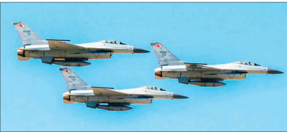
جانب من التمرين