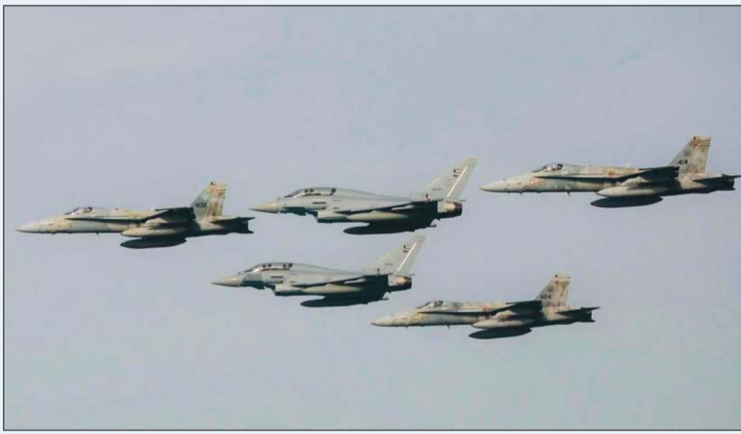
جانب من الطائرات المشاركة في التمرين

تمرين «درع الخليج 2026».. لرفع الجاهزية القتالية