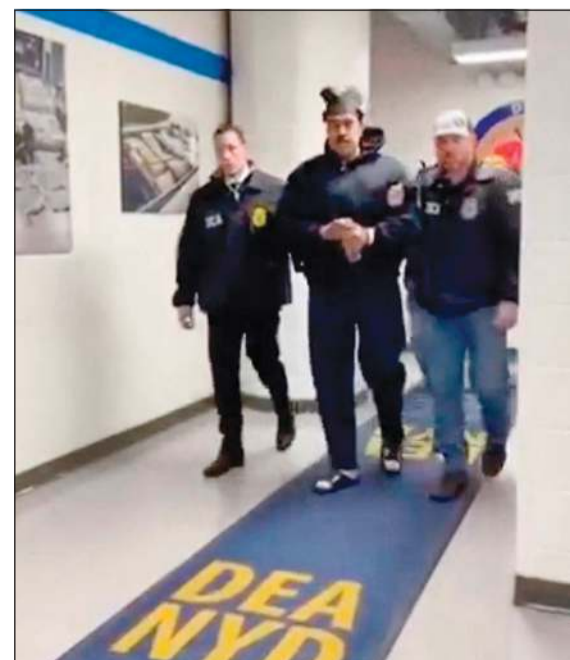
الرئيس الفنزويلي نيكولاس مادورو محاطاً بالحراسة لدى وصوله إلى إدارة مكافحة الإرهاب في مانهاتن بنيويورك (أ.ف.ب.)

إلى ذلك، أعلن وزير النقل الأميركي شون دافي أمس السماح لشركات الطيران الأميركية مجدداً التحليق فوق منطقة البحر الكاريبي. من جهتها، شددت بعثة تقصي الحقائق الدولية المستقلة بشأن فنزويلا التابعة للأمم المتحدة على وجوب ألا تحول «عدم شرعية» الهجوم الأميركي دون محو مادورو أمام القضاء بتهم ارتكاب حكومته انتهاكات جسيمة لحقوق الإنسان وجرائم ضد الإنسانية، مشددة على وجوب محاسبته عن هذه الانتهاكات، بما في ذلك إعدامات خارج نطاق القضاء وإخفاءات قسرية وتعذيب.