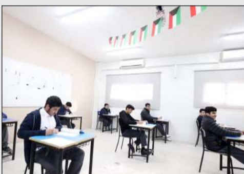
عدد من الطلبة خلال أداء أحد الاختبارات

وزير التربية تفقّد لجان امتحانات الـ 12: تعزيز نزاهة الامتحانات ووصون مصداقية الشهادة الثانوية